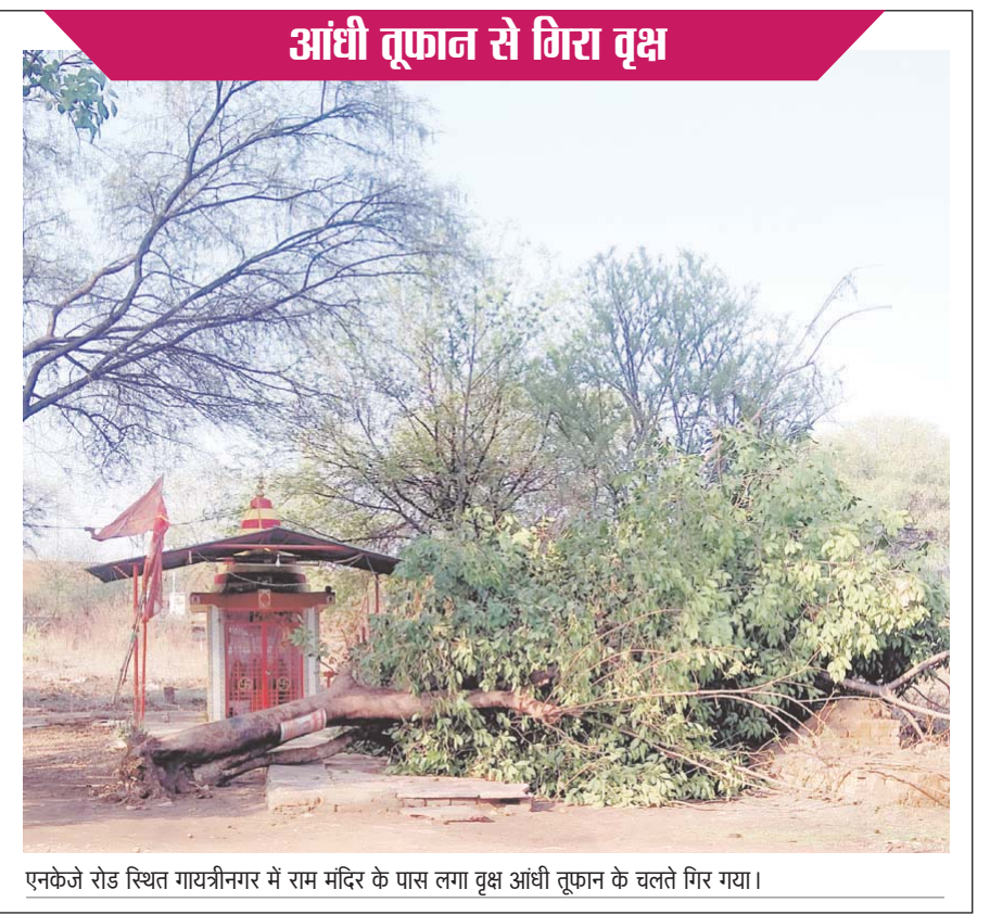
एनकेजे रोड स्थित गायत्रीनगर में राम मंदिर के पास लगा वृक्ष आंधी तूफान के चलते गिर गया।

प्रदेश में 5 मई से 18-44 वर्ष आयु वर्ग के नागरिकों का कोविड-19 टीकाकरण प्रारंभ किया गया है। राष्ट्रीय स्वास्थ्य मिशन मध्यप्रदेश द्वारा इस संबंध में समस्त जिलों के मुख्य चिकित्सा एवं स्वास्थ्य अधिकारी एवं जिलों के टीकाकरण अधिकारियों को आवश्यक निर्देश जारी किये हैं। जिसमें 18-44 वर्ष आयु वर्ग के नागरिकों के लिये कोविड-19 टीकाकरण सत्र आयोजित करने के एक दिवस पूर्व प्रातः 9 बजे से 11 बजे के बीच ऑनलाइन सत्र पोर्टल पर पब्लिश करना सुनिश्चित करने के लिये निर्देशित किया गया है। जिलों द्वारा कोविन पोर्टल पर ऑनलाइन सत्र पब्लिश करने का निश्चित समय निर्धारित नहीं है। जिससे आमजन को स्लॉट बुक करने में परेशानियों का सामना करना पड़ रहा है।