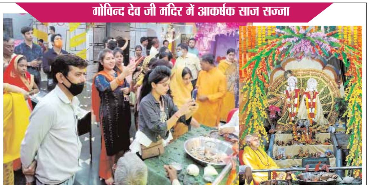
गोविन्द देव जी मंदिर में आकर्षक साज सज्जा

सिल्वर टॉकीज कम्पाउण्ड स्थित श्री गोविन्द देव जी मंदिर में भी जन्माष्टमी का पर्व अपार उत्साह के बीच मनाया गया। पर्व को लेकर यहां आकर्षक विद्युत साज सज्जा की गई थी। कोरोना गाइडलाइन का पालन करते हुए मध्यरात्रि 12 बजे जन्माष्टमी का पर्व मनाया गया। मंदिर में शाम से ही श्रद्धालुओं का आना शुरू हो गया था। मंदिर प्रबंधन कमिटी द्वारा श्रद्धालुओं को भगवान के दर्शन के लिए ऐसी व्यवस्था की गई थी, जिससे एक समय में ज्यादा भीड़ न आए। इसी तरह खिरहनी ओवर ब्रिज के नीचे स्थित रामजानकी मंदिर, राधा भवन के पास स्थित श्रीलक्ष्मी नारायण मंदिर, मेन रोड स्थित श्रीमहालक्ष्मी ट्रस्ट कमिटी धर्मशाला मंदिर, गणेश चौक स्थित मधई मंदिर सहित अन्य मंदिरों में जन्माष्टमी पर्व पर मध्यरात्रि 12 बजे रोहिणी नक्षत्र में नटखट कन्हैया का जन्मोत्सव हर्षोल्लास के बीच मनाया गया।