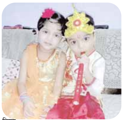
किया गया और पूजा अर्चना करते हुए आरती उतारकर प्रसाद वितरित किया गया। मंदिर परिसर में एक से बढ़कर एक सजीव झांकियां सजाई गई थीं। जिसने श्रद्धालुओं का मन मोह लिया। इसी तरह

कटनी। नंद के आनंद भयो, जय कन्हैयालाल की और बघाई बाबा नंद की, जय कन्हैयालाल की जैसे गगनचुंबी जयघोषों के बीच सोमवार की मध्यरात्रि नटखट कन्हैया का जन्मोत्सव पर्व जन्माष्टमी अपार उत्साह, उमंग के बीच धूमधाम से मनाया गया। इस अवसर पर शहर से लेकर ग्रामीण अंचलों में जन्माष्टमी की धूम रही। मंदिरों और घरों में जन्माष्टमी पर्व की सुबह से ही तैयारियां की जा रही थीं और जैसे ही घड़ी की सुईयों ने रात 12 बजे के आकड़े को छुआ, वैसे ही घरों और मंदिरों में घंटे-घड़ियाल और शंख ध्वनि गूंजने लगे। फूलों की बारिश के साथ भगवान की जन्म आरती हुई।