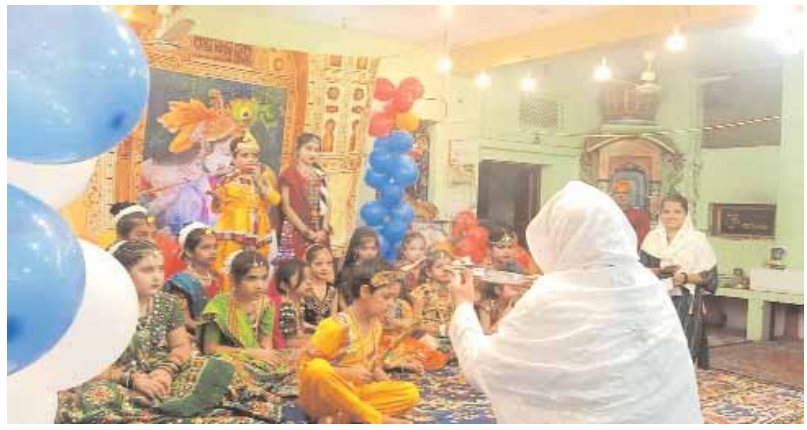
मेहड़ दरबार शांति नगर में धूमधाम से कृष्ण जन्माष्टमी का पर्व मनाया गया। इस अवसर पर यहां बड़ी संख्या में श्रद्धालुओं ने पहुंचकर पुण्यताम अर्पित किया।

बाल-गोपाल को पालने में झुला-झुलाने के लिए श्रद्धालुओं की कतार लगी। माखन-मिश्री का प्रसाद वितरित किया गया। शहर के प्रमुख खिरहनी फाटक क्षेत्र स्थित श्री सत्यनारायण मंदिर में कोरोना गाइडलाइन के चलते मेले का आयोजन नहीं किया गया लेकिन इसके बावजूद भगवान की एक झलक पाने और पूजा अर्चना करते हुए श्रद्धालुओं की भारी भीड़ यहां उमड़ी। शाम से लेकर मध्यरात्रि तक यहां श्रद्धालुओं का ताता लगा रहा। मंदिर के अंदर श्रद्धालुओं को कतारबद्ध करवाकर प्रभु के दर्शन करवाए जा रहे थे। मंदिर परिसर में मध्यरात्रि 12 बजे घंटे-घड़ियालों की गूंज के बीच नटखट कन्हैया का जन्म हुआ और इसके बाद सारा आलम नंद के आनंद भयो, जय कन्हैयालाल की के जयघोषों से गूंज उठा। इसके बाद भगवान का अभिषेक