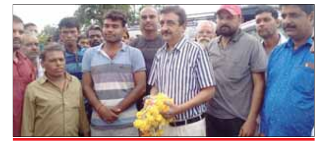
ग्राम भमकी में हुआ स्वागत