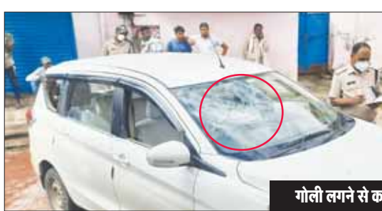
गोली लगने से कार का शीशा टूट गया, पुलिस मौके पर पहुंचकर जांच में जुटी