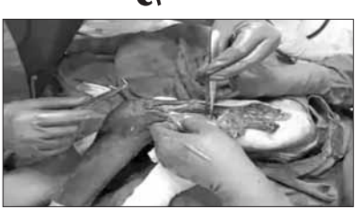
पहली बार एक पैर को ऑपरेशन इंटरलॉकिंग मेलिंग से जोड़ा; दूसरे की सर्जरी 5 दिन बाद

जबलपुर। जबलपुर के नानाजी देशमुख पशुचिकित्सालय विवि के चिकित्सकों ने एक लंगूर को नया जीवन दिया है। सड़क हादसे में लंगूर के दोनों पैरों की हड्डियां 5 टुकड़ों में बंट गई थी। लंगूर की जान बचाने के लिए स्कूल ऑफ वाइल्ड लाइफ फॉरेंसिक एंड हेल्थ के डॉक्टरों ने इंटरलॉकिंग मेलिंग से लंगूर का ऑपरेशन किया। मध्यप्रदेश में इस तरह का ये पहला ऑपरेशन था। 5 दिन बाद दूसरे पैर का भी ऑपरेशन होगा। एक महीने में ही लंगूर पहले की तरह उछल-कूद करने लगेगा, यह पूरी उम्मीद जताई जा रही है। मध्यप्रदेश में पहली बार जबलपुर वेटेनरी विश्वविद्यालय के डॉक्टरों ने लंगूर का ऑपरेशन इंटरलॉकिंग मेलिंग (हड्डी के अंदर राड डालकर बाहर से स्क्रू कसना) से किया है। इससे पहले जो भी ऑपरेशन हुए, उसमें केवल अंदर से रॉड डाली गई थी। नरसिंहपुर जिले की वन विभाग की टीम को 1 सितंबर को ये मादा लंगूर घायल हालत में मिली थी। 10 साल के इस मादा लंगूर के सड़क हादसे में आगे की बांये पैर की हड्डी दो