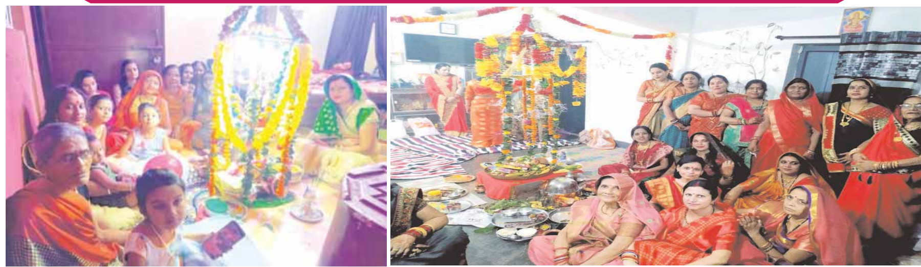
अखंड सोभाग्य की कामना के साथ पति की लंबी आयु के लिए महिलाओं ने कल हस्तारिका तीज के अवसर पर निर्जला व्रत रखा। रात्रि में फुलहरा के नीचे शिव-पार्वती की पूजा अर्चना की गई। आज सुबह विराजते के बाद महिलाओं ने व्रत तोड़ा।