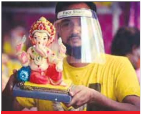
गणेश चतुर्थी की शुभकामनाएं