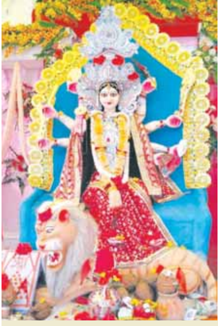
सार्वजनिक दुर्गा समिति नन्हवारा कला