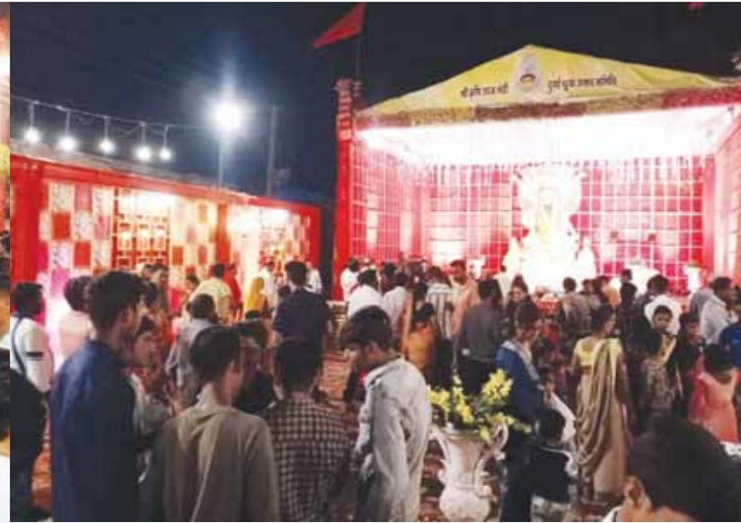
कृषि उपज मंडी परहूआ में स्थापित मां दुर्गा की भव्य प्रतिमा।