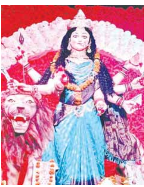
दीनबंधु पान पैलेस आजाद चौक