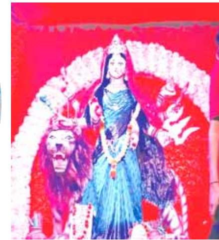
आजाद चौक ब्रिज के नीचे भव्य प्रतिमा