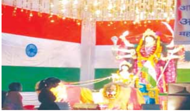
आजादी का अमृत महोत्सव अस्पताल के सामने स्थापित माँ दुर्गा के साथ भारत माता की प्रतिमा