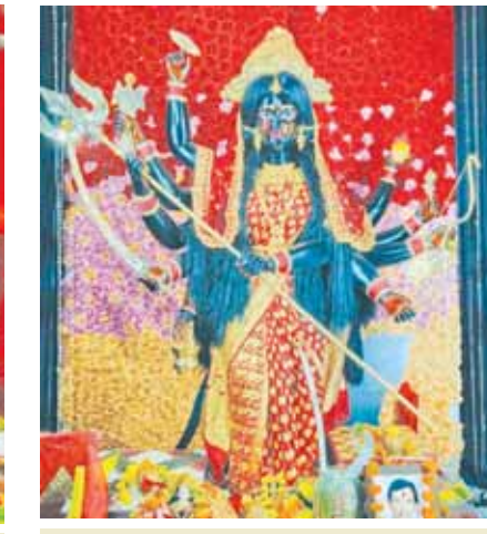
श्री महाकाल सरकार सेवा समिति