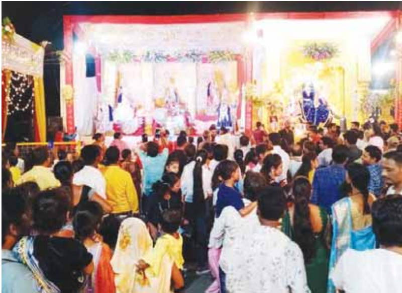
कचहरी चौक में विराजमान जीवित झांकियों को देखने अपार जनसैलाब उमड़ा।

दुर्गाव्रत समितियों द्वारा की गई आकर्षक विद्युत साज-सज्जा से पूरा शहर दृश्या रोशनी से नहा रहा है। समितियों द्वारा पिछले वर्षों की परम्परा का अनुसरण करते हुए इस बार भी नया प्रस्तुत करने का प्रयास किया है। कहीं मां दुर्गा गोद में गणेश जी को लेकर प्यार करती हुई नजर आ रही हैं तो कहीं अपने आंचल में गणेश जी और कार्तिकेय के साथ नजर आ रही हैं तो कहीं मां भवानी की पतिहारिन स्वरूप में स्थापना की गई हैं। अल्फर्टगंज में मां दुर्गा अपने हाथों में नौ गृह लेते हुए नजर आ रही हैं। ये झांकियां शहर में जनाकर्षण का केन्द्र बनी हुई हैं। आज भी इन झांकियों के दर्शनार्थ शहर की सड़कों पर श्रद्धालुओं की भारी भीड़ उमड़ेगी। कल अष्टमी पर मां जगतजननी के विभिन्न स्वरूपों के दर्शनार्थ अपार जनसैलाब उमड़ पड़ा। शहर की ऐसी कोई सड़क नहीं थी, जहां श्रद्धालु नजर न आ रहे हों। सड़कों में उमड़ी अपार भीड़ के चलते शहर के अंदरूनी मार्गों से लेकर राष्ट्रीय राजमार्ग पर घंटों यातायात बाधित होता रहा। आजाद चौक, चांडक चौक, गर्ग चौराहा, हीरागंज, सुखन चौक, शेर चौक, झंडा बाजार, कचहरी चौक, टाकोज रोड में पैदल चलने तक की जगह नहीं बची थी। हालांकि चौराहों में पुलिस कमियों की तैनाती की गई थी। पुलिस कमियों ने तत्परता से जाम खुलवाया।