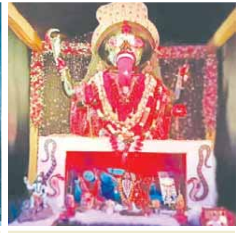
सब्जी मंडी में विराजी मां काली