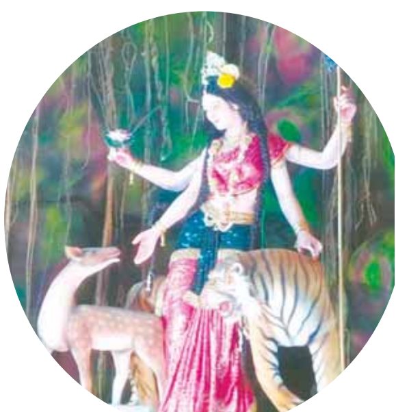
शंकर मंदिर दुर्गात्सव समिति आजाद चौक