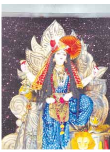
शेर चौक में बिराजी दुर्गा प्रतिमा