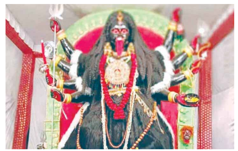
सब्जी मंडी में बिराजी माँ काली की भव्य प्रतिमा