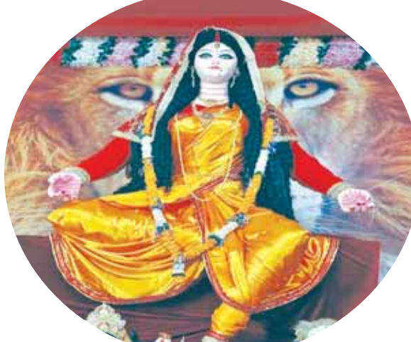
श्री युवा दुर्गात्सव समिति, पन्ना मोड़