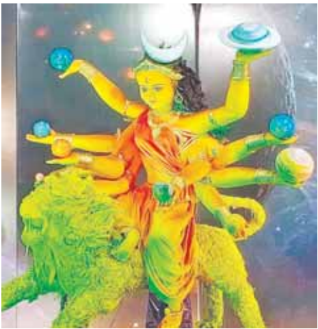
बाल समाज दुर्गात्सव समिति विश्कर्मा पार्क