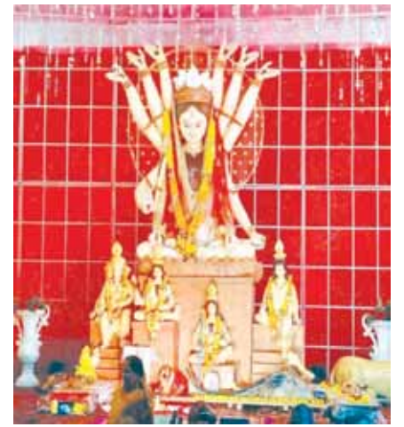
श्री कृषि उपज मंडी दुर्गा पूजा समिति