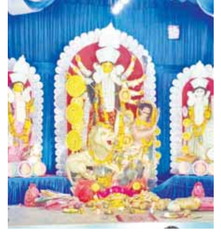
बंगाली दुर्गा पूजा समिति द्वारका भवन