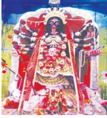
आशीर्वाद नवजागरण समिति