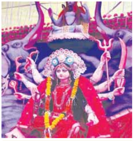
शिवमन्दिर दुर्गात्सव एनकेजे