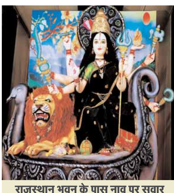
राजस्थान भवन के पास नाव पर सवार जगदम्बा की भव्य प्रतिमा