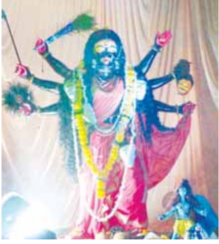
मरही माता मंदिर हीरागंज