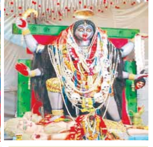
खेर माई समिति अल्फर्ट गंज