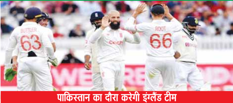
पाकिस्तान का दौरा करेगी इंग्लैंड टीम

मोईन ने 2014 में अपना टेस्ट डेब्यू किया था और इसके बाद उन्होंने 64 टेस्ट मैच में 28.29 की औसत से 2914 रन बनाए और साथ ही 195 विकेट भी झटके। मोईन ने पिछले साल सितंबर 2021 में टेस्ट फॉर्मेट से अपने संन्यास का ऐलान कर दिया था। उन्होंने ओवल में भारत के खिलाफ अपना आखिरी टेस्ट मैच खेला था।