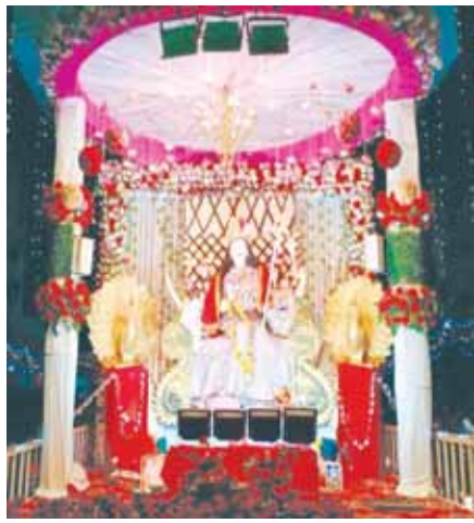
आजाद चौक में विराजी प्रतिमा