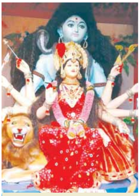
शहरस्त्रबाहु दुर्गात्सव मेन रोड, कटनी