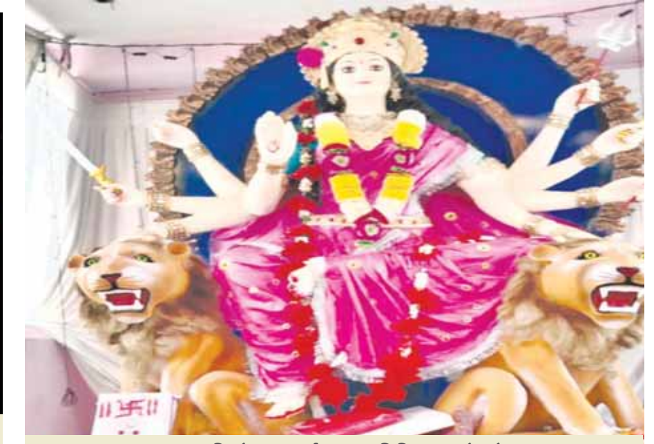
शारदा मंदिर रेणुका दुर्गा उत्सव समिति अंधा मोड़ रोड