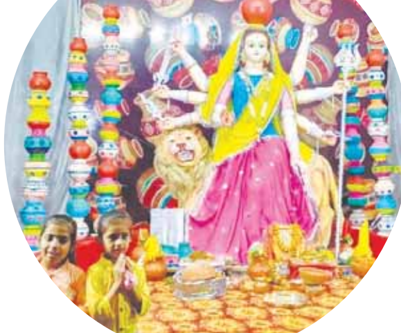
वीरू परिवार केसीएस स्कूल