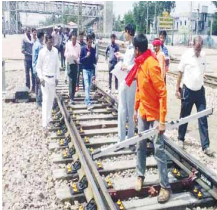
कल से पटरी पर लौट आएंगी प्रभावित ट्रेनें

इस ट्रेक पर अब एक साथ दो ट्रेनें दौड़ सकेंगी। सिग्नल ट्रेक होने के कारण ट्रेनों के परिचालन में विलंब होता था। इस कार्य के होने से ट्रेनों की लेटलतीफी भी कम होगी। इस संबंध में रेलसूत्रों से मिली जानकारी के अनुसार एनकेजे यार्ड में मैकेनिकल इंटरलॉकिंग सिग्नलिंग प्रचालन सिस्टम के साथ अब तक काम किया जा रहा था। इस प्रणाली में अलग-अलग केबिन से ट्रेनों को रिसीव और डिस्पैच करने के लिए मैनुअल लीवर का प्रयोग किया जाता था। प्रत्येक ट्रेन को परिचालित करने के लिए केबिन के बीच मैनुअल संचालन और समन्वय में लगभग 5 से 7 मिनट का समय लगता था। इसके अतिरिक्त ट्रेन संचालन में वैश्विक संरक्षा मानकों के स्तर के अनुरूप होने के लिए मैकेनिकल सिग्नलिंग को अपग्रेड भी करने की आवश्यकता थी। इलेक्ट्रॉनिक इंटरलॉकिंग होने के बाद अब मैनुअल की कम्प्लेक्सिटी तकनीक से गाइडों के लिए रूट सेट किया जाएगा। पुरानी केबिन को बंद कर विजुअल डिस्प्ले यूनिट रूम से गाइडों का संचालन किया जाएगा।