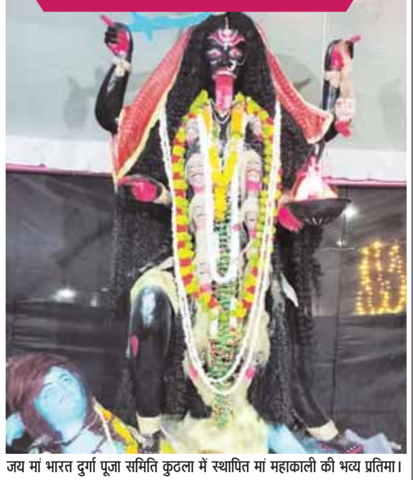
जय मां भारत दुर्गा पूजा समिति कुठला में स्थापित मां महाकाली की भव्य प्रतिमा।