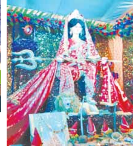
ज्वाला चक्री के पास रखी प्रतिमा