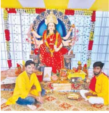
सर्व मित्रमंडली समिति सिंघई बगीचा