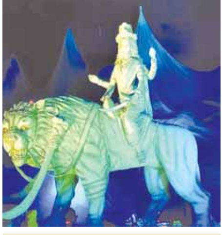
पुत्री शाला हीरागंज