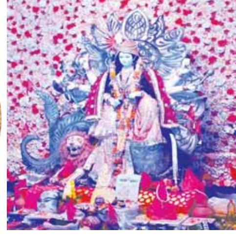
हीरागंज दुर्गात्सव समिति