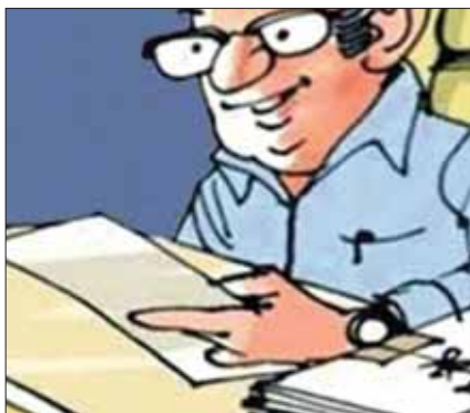
तहसीलदारों को मौका नहीं मिलेगा।

भोपाल, यशभारत। मध्यप्रदेश सरकार 220 सीनियर तहसीलदारों को कार्यवाहक डिप्टी कलेक्टर बनाने जा रही है। इसकी फाइल भी रही है। संभवतः 25 फरवरी के बाद लिस्ट आ सकती है। ये तहसीलदार पिछले 7 साल से प्रमोशन का इंतजार कर रहे हैं। वर्ष 1999 से 2008 के बीच के तहसीलदार इस क्राइटेरिया में आ रहे हैं। जिनकी विभागीय जांच चल रही है, वे डिप्टी कलेक्टर नहीं बन पाएंगे। इधर, कुल 173 नायब तहसीलदारों को भी तहसीलदार का प्रभार दिए जाने की प्रोसेस चल रही है। बता दें कि मध्यप्रदेश राजस्व अधिकारी संघ पिछले एक साल से पुलिस विभाग की तर्ज पर तहसीलदारों को प्रमोशन देने की मांग उठा रहा है। इसे लेकर छरूमन्त्री से गुहार लगाई जा रही थी। इसके बाद सरकार स्तर पर प्रोसेस शुरू की गई, जो अब अंतिम दौर में है। बताया जा रहा है कि जीएडी (सामान्य प्रशासन विभाग) में फाइल दौड़ रही है।