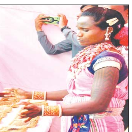
इन इलाकों में घूम-घूमकर किया था संग्रह

डिंडोरी कलेक्टर ने किया सपना साकार, डिंडोरी जिले के करीब 880 आदिवासी परिवारों की करेंगे मदद