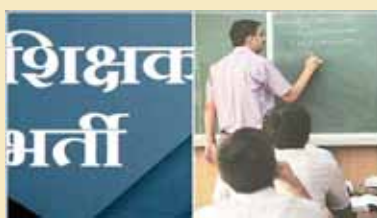
■ भोपाल, यशभारत।