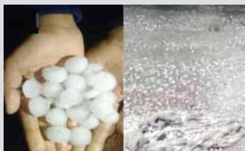
बताया। वहीं शाहपुरा शासकीय स्कूल के भवन की एक दीवार भी तेज वर्षा के बीच गिर गई। अरेरा कालोनी व कोटरा क्षेत्र में 33केवी के दो-दो फीडर बंद हो गए। ये फीडर इंसुलेटर के खराब होने के कारण बंद हो

राजधानी में सोमवार को हुई वर्षा ने बिजली व्यवस्था की पोल खोलकर रख दी। श्यामला हिल्स, प्रोफेसर कालोनी, इंदरपुरी, लक्ष्मीनगर समेत शहर के अधिकतर क्षेत्रों में बिजली गुल हो गई। शाम करीब सवा छह बजे से गुल हुई बिजली रात 10 बजे तक नहीं आई। तब तक लोगों को परेशान होना पड़ा। इस दौरान बिजली कंपनी के चैटबोट नंबर को छोड़कर बाकी के माध्यमों से संपर्क कट गया। हालांकि रात 10 बजे के बाद ज्यादातर क्षेत्रों में आपूर्ति बहाल करना शुरू कर दिया था लेकिन रात 12 बजे तक कुछ क्षेत्रों में अंधेरा छाया हुआ था। बिजली कंपनी के अधिकारियों ने बिजली बंद होने की वजह इंदरपुरी, लक्ष्मीनगर समेत कई क्षेत्रों में तारों पर पेड़ व उनकी डालिया गिरना और फीडरों के इंसुलेटर अचानक खराब होना