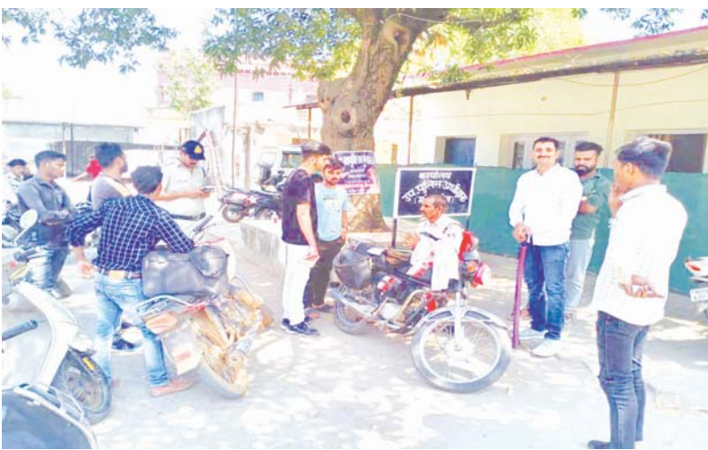
तीन सवारी पर 3 समन शुल्क 1500 रुपए, ब्लेक फिल्म पर एक हजार रुपए साइलेंसर मोडिफिकेशन कार्रवाई कर 5 हजार रुपए जुर्माना लगाया है।

कटनी, यशभारत। पुलिस अधीक्षक अभिजीत रंजन के निर्देश पर यातायात नियम तोड़ने वालों, नशे में वाहन चलाना, बिना नंबर प्लेट वाले वाहन, ओवरलोड वाहन, मोडिफाई साइलेंसरों पर सबसे ज्यादा सख्ती कर जुर्माने की कार्रवाई की जा रही है। कपड़े से चेहरा ढककर चलने वालों पर चालानी कार्रवाई कर पृथलाख की जा रही है। पुलिस ने 1 अप्रैल से लेकर 10 अप्रैल तक 3162 वाहन चेक किए हैं। जिनमें से 1296 वाहनों पर जुर्माने की कार्रवाई की गई है। बिना हेलमेट पर वाहन चालकों पर 960 चालान से 2 लाख 88 हजार रुपए जुर्माना लगाया है। इसी प्रकार नशे में वाहन चलाने पर पांच कार्रवाई में 51 हजार 500 रुपए जुर्माना, 6 ओवरलोड वाहन पर कार्रवाई कर 73 हजार जुर्माना, बिना सीटबेल्ट 40 कार्रवाई कर 20 हजार रुपए, बिना नंबर प्लेट के 104 वाहन चालकों से 52 हजार रुपए रैड लाइट जंप करने पर 175 के खिलाफ चालान काटकर 87 हजार 500 रुपए वसूल किए हैं।