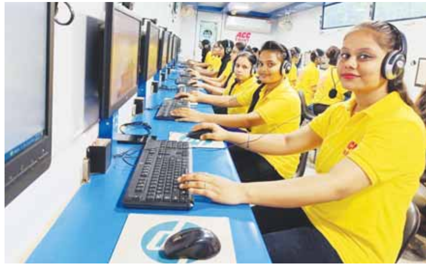
अमेहटा प्लांट के आस-पास ग्रामीण क्षेत्रों में रहने वाली शिक्षित महिलाओं को उनके घर पर ही कोई ऐसा रोजगार दिया जाये जिससे वे आत्मनिर्भर बनकर अपने परिवार का भरण पोषण कर सकें। इस मंशा को पूरी करने के उद्देश्य से पिछले साल महिलाओं पर केंद्रित रूरल बीपीओ पायलट प्रोजेक्ट शुरू किया गया था। पायलट प्रोजेक्ट को सफल बनाने इंडिविजुअल फाउंडेशन से भी सझेदारी की गई।