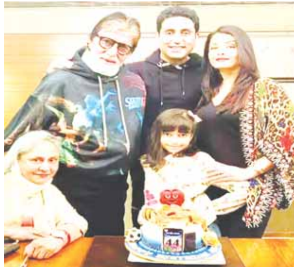
इस फेक न्यूज के बाद अब बच्चन से दखिल याचिका में कहा गया है कि परिवार काफी नाराज है. परिवार के तरफ आराध्या अभी छोटी है और ऐसे में इस

नई दिल्ली, एजेंसी। अमिताभ बच्चन की पोता और ऐश्वर्या राय की बेटी आराध्या बच्चन एक बार फिर से चर्चा में है और इसकी वजह इस बार उनके कपड़े और हेयरस्टाइल नहीं है। दरअसल बॉलीवुड के सबसे बड़े घर की पोती और बेटी आराध्या बच्चन के नाम पर जो फेक खबरें चल रही हैं उससे पूरा बच्चन परिवार परेशान हो गया है और यही वजह है कि अब उन्होंने इसके लिए कानून का सहारा लिया है, दरअसल पिछले काफी समय से आराध्या बच्चन को स्वास्थ्य से लेकर उनकी बाकि चीजों से जुड़े फेक न्यूज चल रही थी और इस मामले में बच्चन परिवार ने दिल्ली हाई कोर्ट का दरवाजा खटखटाया है, तो चलिए जानते हैं क्या है पूरा मामला.