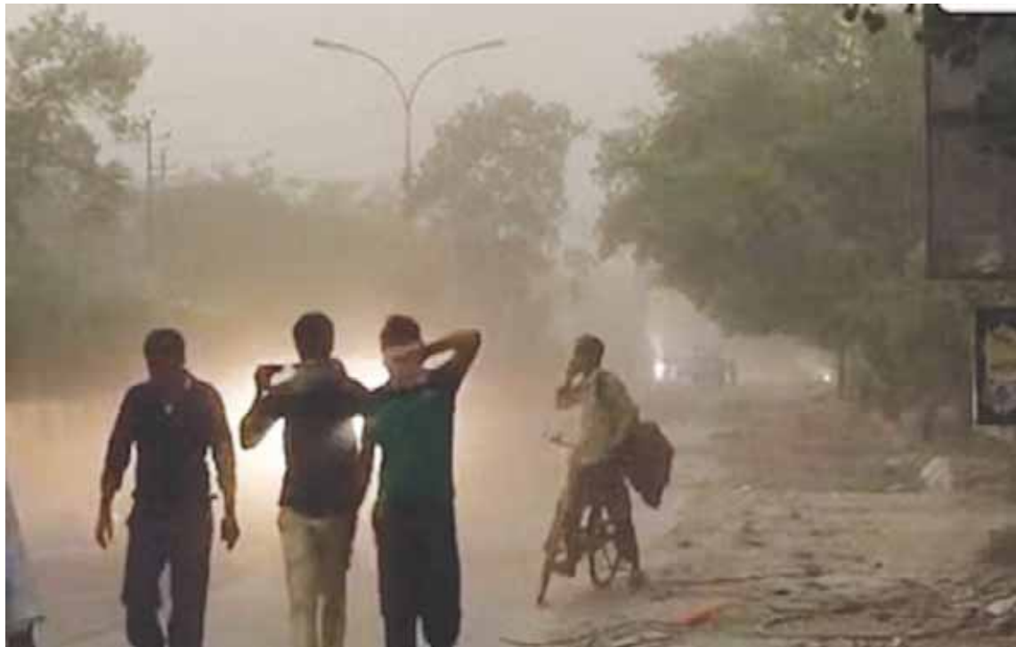
विक्षोभ के कारण मौसम में परिवर्तन आया है। उन्होंने बताया कि इस दौरान अगले 24 घंटे में जिले में कहीं-कहीं बूंदबादी हो सकती है। दूसरी ओर फसलों के नुकसान को लेकर उनका कहना है कि जो फसलें पक कर तैयार हो गई हैं, उनको नुकसान हो सकता है और किसानों को सलाह है

कटनी, यशभारत। पश्चिमी विक्षोभ का असर जिले में एक बार फिर देखने को मिल रहा है। बीती मौसम में रात से अचानक परिवर्तन के साथ ठंडी हवाएं चलने लगीं तेज हवाओं से आंधी तूफान सा माहौल बन गया देर रात तक यह माहौल चला हल्की बूंदबादी हुई इस बीच हवा से बोर्ड हॉर्डिंग फ्लेक्स आदि भी कई जगह उड़ गये। कटनी में तेज हवा चले और बिजली की व्यवस्था न चरमारए ऐसा भला कैसे हो सकता है। ठीक इसी का फिर से उदाहरण देखने को मिला तेज हवा का असर सबसे पहले शहर और पूरे जिले की विद्युत व्यवस्था पर पड़ा अधिकांश क्षेत्रों की बिजली बंद हो गई। व्हाट्सएप ग्रुपों में हर जगह से लाइट बंद होने की सूचनाएं मिल रही थीं। बिजली अमला इधर उधर दौर कर व्यवस्था ठीक करने में जुटा था पूरी रात आसमान पर बादलों के डेरे के साथ तेज हवा लेकिन ठंडी हवा से गर्मी में राहत दिखी हालांकि आज सुबह से फिर से तेज धूप निकली हालांकि तापमान में कल के मुकाबले आज कमी थी। रह रह कर बदल रहा था आसमान मौसम विभाग के अनुसार अभी दो दिनों तक मौसम के ऐसे ही बने रहने की संभावना है। मौसम विभाग ने बताया कि पश्चिमी