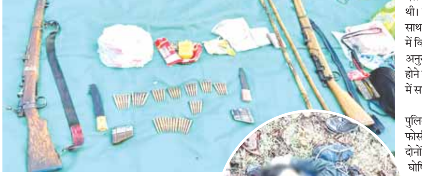
■ बालाघाट, यशभारत।