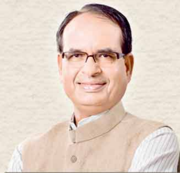
शिवराज सिंह चौहान, मुख्यमंत्री