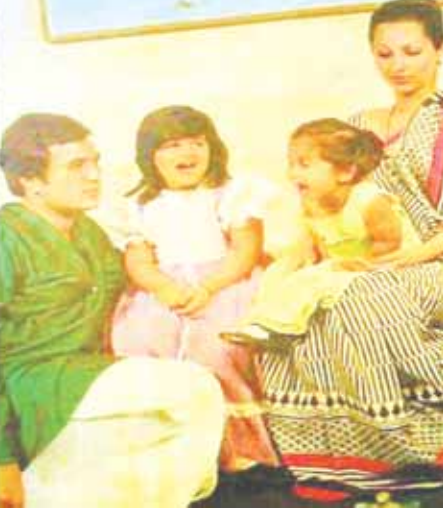
के अंदर पैर रखते ही ये एहसास हुआ था कि राजेश खन्ना से शादी का फैसला कितनी बड़ी भूल थी। डिंपल ने इंडिया टुडे