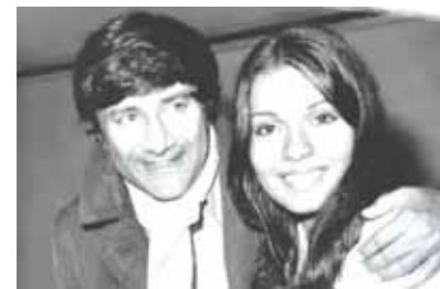
एट्टी करते समय हर एक्टर एक स्टारमेकर की उम्मीद करता है। कुछ ही हैं जो पोटेंशियल और महत्वाकांक्षा की चमक देखते हैं जो शायद अब तक केवल खुद को ही दिखाई दे रही थीं। बहुत कम लकी हैं जो इस इंसान को पास सके, लेकिन मैं थीं। मेरे स्टारमेकर देव साब थे।

मुंबई, एजेंसी। बॉलीवुड की वेटेन एक्ट्रेस जीनत अमान ने हाल ही में सोशल मीडिया ज्वाइन किया है और वो आए दिन अपने सोशल मीडिया पर किसी ना किसी तरह की नई खबर देती रहती हैं। 70-80 के दशक की बॉलड और खूबसूरत अभिनेत्रियों में गिनी जाने वाली दिग्गज अभिनेत्री जीनत अमान इन दिनों लगातार चर्चाओं में बनी हुई हैं। इंस्टाग्राम पर आए दिन अपनी ग्लैमरस तस्वीरें डालना है। एक्ट्रेस ने देव आनंद संग अपनी फोटो शेंयर की है और उनके साथ का जुड़ा अमान अनुभव भी शेयर किया है। चलिए जानते हैं तस्वीरों के जरिए आखिर उन्होंने एक्टर के बारे में क्या बोला?