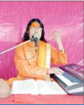
पूर्णाहुति व भंडार आयोजन आज