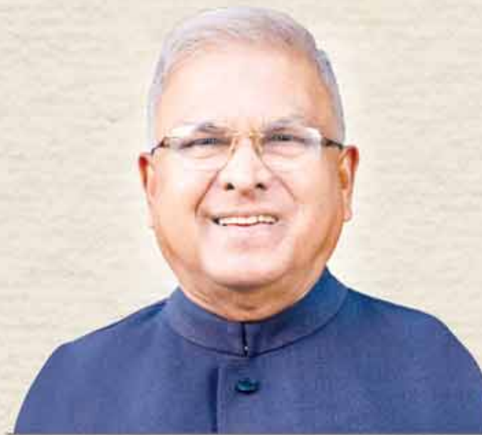
मंगुभाई पटेल, राज्यपाल