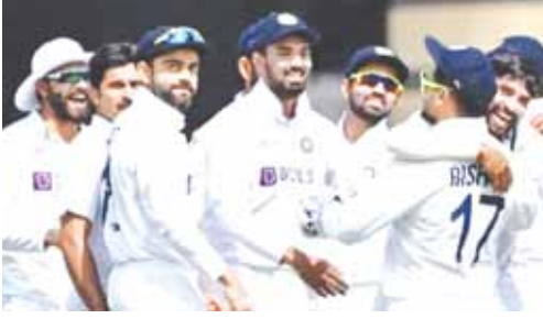
का ही इस्तेमाल किया गया था।

नई दिल्ली, एजेंसी। टीम इंडिया वर्ल्ड टेस्ट चैंपियनशिप की तैयारी में लगी हुई है। भारत और ऑस्ट्रेलिया के बीच 7 जून से इंग्लैंड में फाइनल खेला जाना है। कप्तान रोहित शर्मा 2013 के बाद भारतीय टीम को पहली आईसीसी टॉफी दिलाना चाहेंगे। इस बीच फाइनल में प्रयोग होने वाली बॉल को लेकर बड़ी खबर आ रही है। भारत में टेस्ट के मुकामले एसजी बॉल से खेले जाते हैं, जबकि ऑस्ट्रेलिया में कुकाबुरा का प्रयोग होता। लेकिन फाइनल ड्यूक बॉल से होगा। क्रिकेट की वर्ल्ड संस्था आईसीसी ने इसका कारण भी बताया है। मालूम हो कि फाइनल के लिए दोनों ही टीमों घोषित हो चुकी हैं। एक खबर के अनुसार, फाइनल मुकामला इंग्लैंड में होगा है। ऐसे में होस्ट देश के मुताबिक बॉल का इस्तेमाल मैच में किया जाएगा। इंग्लैंड में टेस्ट के मैच ड्यूक बॉल से खेले जाते हैं। आईसीसी के सूत्र ने बताया कि आईसीसी मेजबान देश की पसंद की गेंद का उपयोग मैच में करता है। इसलिए WTC फाइनल में ड्यूक बॉल का ही प्रयोग किया जाएगा। इससे पहले 2021 में भी वर्ल्ड टेस्ट चैंपियनशिप के पहले सीजन का फाइनल इंग्लैंड में खेला गया था और तब भी ड्यूक बॉल