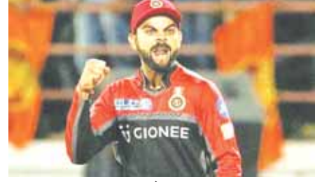
केवल एक साझेदारी दूर थे और वह विशेष रूप से इस बात से नाराज थे कि उनके बल्लेबाज ऐसे कैसे आउट हो गए।

नई दिल्ली, एजेंसी। रॉयल चैलेंजर्स बैंगलोर के स्टैंड-इन कप्तान विराट कोहली ने स्वीकार किया कि उनकी टीम 'हारने का हकदार' थी। कोलकाता नाइट राइडर्स के खिलाफ मिली 21 रन की हार के बाद विराट ने कहा कि उनके खिलाड़ियों ने मैदान पर काफी गलतियां कीं और विरोधी टीम को जीत तोहफे में दे दी। यह आईपीएल में आरसीबी पर केकेआर की लगातार पांचवीं जीत थी। विराट कोहली ने पांचवां अर्धशतक जड़ा। इस सीजन में यह उनकी पांचवीं फिफ्टी है, लेकिन स्टैंड-इन कप्तान को बाकी बल्लेबाजी लाइनअप से समर्थन नहीं मिला। वह अंत तक लक्ष्य का पीछा नहीं कर पाए। 34 वर्षीय स्टार बैटर हार के बाद अपनी टीम के निराशाजनक प्रदर्शन से खुश नहीं थे। उन्होंने स्वीकार किया कि आउटफील्ड में कुछ महत्वपूर्ण कैच छोड़ने के बाद और केकेआर को 20 ओवर्स में 200/5 का स्कोर बनाने देना उनकी गलती थी और इसीलिए वे इस हार के हकदार थे। आरसीबी के फील्डरों ने कोलकाता नाइट राइडर्स के कप्तान नितेश राणा को दो जीवनदान दिए जबकि रॉय का भी कैच टपकाया। कोहली ने मैच के बाद कहा, चर्चमानदारी से कहूँ तो हमने उन्हें मैच तोहफे में दे दिया। हम हारने के हकदार थे। हम पर्याप्त पेशेवर खेल नहीं दिखा सके। हमने अच्छी गेंदबाजी की, लेकिन फील्डिंग स्तर के अनुरूप नहीं थी। हमने उन्हें मुफ्त का तोहफा दे दिया। ज कोहली ने महिपाल लोमरोर के साथ एक महत्वपूर्ण साझेदारी की, लेकिन लोमरोर 34 रन जोड़ने के बाद आउट हो गए। इसके बाद आरसीबी साझेदारी के लिए परेशान दिखी। विराट ने कहा कि वे खेल जीतने से