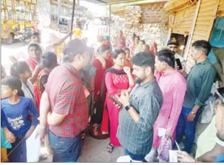
उपस्थित हितग्राहियों से अलग-अलग पहलुओं पर चर्चा करते हुए सेल्समैन एवं कर्मचारियों से राशन दुकान में कितना स्टॉक है उसकी जानकारी सहित पूर्व में किए गए वितरण के बारे में भी