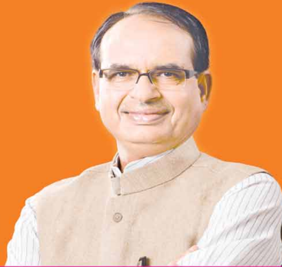
शिवराज सिंह चौहान, मुख्यमंत्री