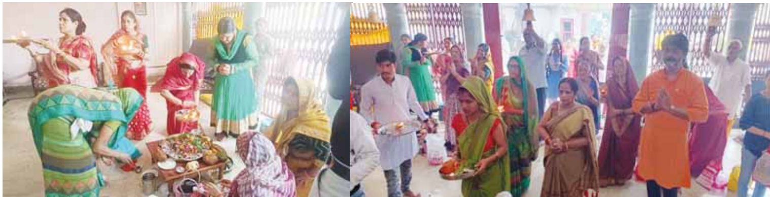
शिव मंदिर सोनी के बगीचा गायत्री नगर में भव्य कलश यात्रा के साथ संगीतमय श्री शिवमहापुराण कथा का उमंग व उत्सव के साथ शुभारंभ हो गया है विभिन्न देवी देवताओं के ध्वज तले निकाली गयी जिसमें शिव मन्दिर से प्रारंभ होकर बाबा घाट गायत्री माता मन्दिर केमा बाबा मन्दिर से होकर के कथा पंडाल पहुंची कलश यात्रा में भक्तों की भीड़ ने आध्यात्मिक छटा बिखेर कर रख दी कथा शुभारंभ से पहले नगर भव्य कलश यात्रा बेहद आकर्षण का केंद्र रही

गायत्री नगर में भव्य कलश यात्रा के साथ संगीतमय श्री शिवमहापुराण कथा