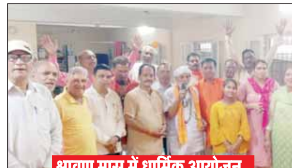
श्रावण मास में धार्मिक आयोजन

मेडिकल अस्पताल मुख्य द्वार के ठीक सामने तिलवारा की ओर जाने वाली रोड को चाय, पान, समोसे के ठेके लगाने व दुकानदारों के अतिक्रमण ने बॉटल नेक बना दिया है। करीब तीस फीट चौड़ी सड़क यहां बमुश्किल दस से आठ फीट ही बचती है। दुकानदार अपनी दुकानें बिल्कुल सड़क पर लगाकर लगा रहे हैं। यहां आने वालों के वाहन जब खड़े होते हैं तो कोई भी वाहन यहां से रेंगते हुए ही गुजरता है। कई बार तो जाम भी लग जाता है। ग्राहकों के वाहनों को हटाने यदि किसी ने कहा तो दुकानदार झगड़ा करने पर उतारू हो जाते हैं। ये स्थिति प्रतिदिन देखी जा सकती है। मुख्य मार्ग से करीब 30 फीट पीछे दुकानें बनी हैं। किंतु दुकानदार नियत जगह से दुकान न लगाकर 20 से 25 फीट बाहर अपना सामान बेचने को लिए सजा लेते हैं। जो सीधे सड़क किनारे पहुंच जाते हैं।