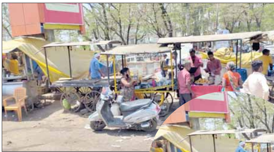
ठगे जा रहे मरीज, गली बना मुख्य मार्ग

मेडिकल अस्पताल मुख्य द्वार के ठीक सामने तिलवारा की ओर जाने वाली रोड को चाय, पान, समोसे के ठेके लगाने व दुकानदारों के अतिक्रमण ने बॉटल नेक बना दिया है। करीब तीस फीट चौड़ी सड़क यहां बमुश्किल दस से आठ फीट ही बचती है। दुकानदार अपनी दुकानें बिल्कुल सड़क पर लगाकर लगा रहे हैं। यहां आने वालों के वाहन जब खड़े होते हैं तो कोई भी वाहन यहां से रेंगते हुए ही गुजरता है। कई बार तो जाम भी लग जाता है। ग्राहकों के वाहनों को हटाने यदि किसी ने कहा तो दुकानदार झगड़ा करने पर उतारू हो जाते हैं। ये स्थिति प्रतिदिन देखी जा सकती है। मुख्य मार्ग से करीब 30 फीट पीछे दुकानें बनी हैं। किंतु दुकानदार नियत जगह से दुकान न लगाकर 20 से 25 फीट बाहर अपना सामान बेचने को लिए सजा लेते हैं। जो सीधे सड़क किनारे पहुंच जाते हैं।