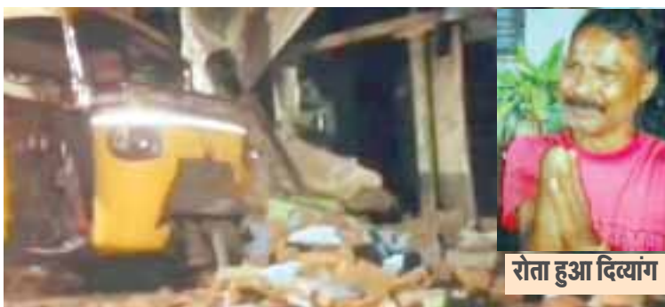
रोता हुआ दिव्यांग

जबलपुर, यशभारत। चूं तो मीडिया में आकर समाज के सामने एक अच्छा चेहरा पेश करने लोग अक्सर गरीबों की मामूली मदद करके प्रसिद्धि पाने का प्रयास करते हैं लेकिन जब कोई बड़ा मामला होता है तो फिर ऐसे जनप्रतिनिधि, नेता, सामाजिक संगठन के पदाधिकारी और प्रशासन के जिम्मेदार अधिकारी अपने पैर पीछे खींचते नजर आते हैं। इसकी एक बानगी उस वक्त देखनी मिली जब रात को तेज बारिश के दौरान गढ़ा जोन क्रमांक-1 में रहने वाला दिव्यांग आंटी चालक का एक कमरे का कच्चा मकान ढह गया और उसके घर के पास खड़ा आंटी बुरी तरह क्षतिग्रस्त हो गया।