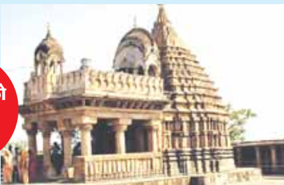
होगा। ऋषि ने जल समाधि ले ली। ऋषि की प्रतीक्षा में भगवान यहीं विराजमान हो गए। तब भगवान शंकर ने

जबलपुर, यशभारत। विश्व प्रसिद्ध मेड़ाघाट के पास 50 फीट ऊंचे पर्वत पर बना प्रसिद्ध गौरीशंकर चौसठयोगिनी मंदिर के बारे में किंवदंती है कि भगवान शंकर और माता पार्वती भगवान पर निकले थे। मेड़ाघाट में ऊंचाई वाले स्थान पहुंचे। यहां सुवर्ण ऋषि तप कर रहे थे। भगवान के दरशन पाकर वे प्रसन्न हो गए। भगवान शंकर व मा पार्वती से प्रार्थना की, हे भगवान जब तक वे नर्मदा पूजन कर न लौटें, आप यहीं रहें। ऋषि सुवर्ण के मन में नर्मदा का पूजन करते समय भाव आया कि भगवान यहीं विराजमान हो जाएं तो सभी का कल्याण