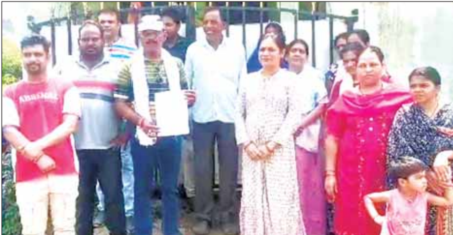
कच्चा कर अवैध निर्माण कर लिया है। इसके साथ ही इन्होंने बताया कि सीडी झारिया द्वारा घर का गंदा पानी सड़क पर बहाया जा रहा है जिससे कई बीमारियां फैल रही हैं। जानकारी के अनुसार मामले की शिकायत क्षेत्रीय रहवासियों द्वारा विगत 31 अगस्त 2021 से लगातार समय समय पर नगर निगम में की जा रही है लेकिन आज तक कोई कार्रवाई नहीं की गई है। जिससे परेशान होकर क्षेत्रीय रहवासियों ने अब नगर निगम आयुक्त स्वप्निल वानखेड़े की शिकायत पत्र भेजकर कार्यवाही की मांग की है।

पिछले 5 सालों से सीडी झारिया ने 20 फीट की सड़क पर 15 फीट पर अवैध निर्माण कर कच्चा कर लिया है। मामले की शिकायत नगर निगम, सीएम हैल्पलाइन और महापौर से कई बार की गई लेकिन आज तक कोई कार्रवाई नहीं हुई है।