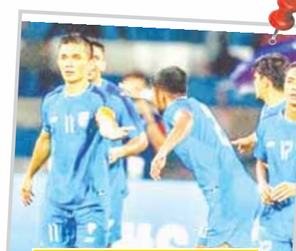
मंत्रालय की अनुमति... पेज 7

• वर्ष-17 अंक 173 • जबलपुर • सोमवार, 24 जुलाई, 2023 • मूल्य- 2 रुपए • पृष्ठ-8 • प्रथम श्रावण मास शुक्ल पक्ष 8 • विक्रम संवत् 2080 शके 1935