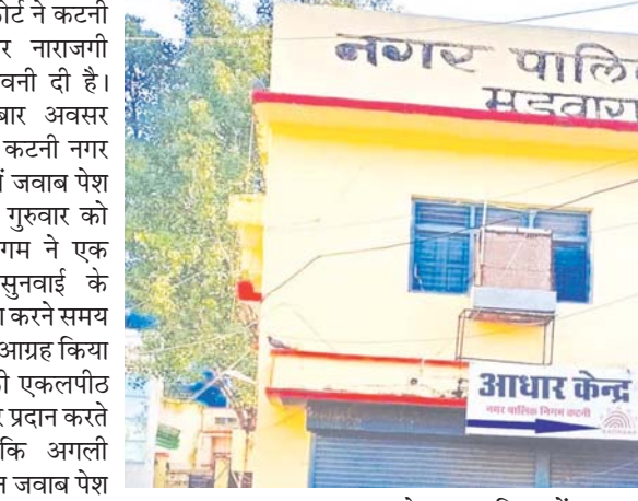
तरफ से दायर याचिका में कहा गया था कि नगर सुधार न्यास द्वारा दुगारी नाला स्थित भूमि पर योजना

बार-बार अवसर देने के बाद भी कटनी नगर निगम ने कोर्ट में जवाब पेश नहीं किया