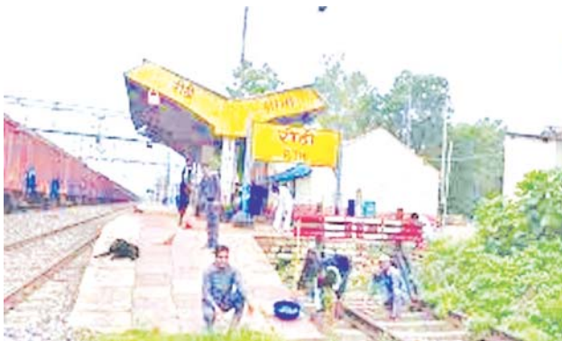
व्यापारी वर्ग और स्कूली छात्र छात्राएं कॉलेज और विद्यालय सुविधाजनक ट्रेने से सफर करते थे।

कटनी-बीना रेल खंड के रीठी रेलवे स्टेशन पर रूकने वाली भोपाल-इटासी विंध्याचल एक्सप्रेस जो रीठी से प्रतिदिन निकल रही, लेकिन विंध्याचल एक्सप्रेस का स्टॉपेज रीठी रेलवे स्टेशन से खत्म कर दिया है। कोविड-19 काल के समय से बंद पड़ी जबलपुर-कोटा एक्सप्रेस को रेलवे ने पटरी से ही गायब कर दिया है। महत्वपूर्ण ट्रेन का कहीं अता-पता नहीं है। कोविड के दौरान बंद हुई सभी ट्रेनों का संचालन प्रारंभ रेल प्रशासन ने कर दिया है, लेकिन बीना, सागर, दमोह, रीठी, कटनी, सलेया ट्रेक की महत्वपूर्ण ट्रेन सुबह के वक 10 बजे जबलपुर पहुंचाती थी। आम यात्री, कर्मचारी, अप डाउन कर्मचारी, मजदूर वर्ग, क्षेत्रीय किसान वर्ग,