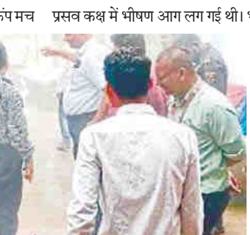
स्वास्थ्य कर्मियों ने तत्परता दिखाई और समय रहते बुझा दी आग

जिला चिकित्सालय में तीसरी घटना से मचा हड़कंप