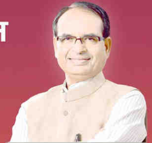
शिवराज सिंह चौहान मुख्यमंत्री