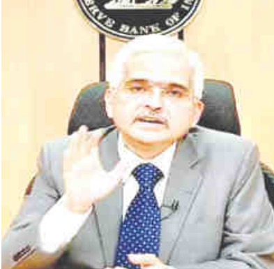
महंगाई और रेपो रेट में क्या है कनेक्शन?

देश में महंगाई के उच्च स्तर पर पहुंचने के बाद इसे तय दरों में वापस लाने के लिए रिजर्व बैंक ने मई 2022 के बाद से लगातार नौ बार Repo Rate में इंजाफा किया था। इस अवधि में ये दर 250 बेसिस प्वाइंट बढ़ाई गई थी। हालांकि, महंगाई पर कंट्रोल के साथ ही केंद्रीय बैंक ने इसमें बदलाव पर ब्रेक लगा दिया और फरवरी 2023 के बाद से इनमें कोई बदलाव नहीं किया गया है। एक्सपर्ट्स भी उम्मीद जता रहे थे कि RBI रेपो रेट को स्थिर रख सकता है। इससे पहले अप्रैल और जून में हुई बैठक में भी इस दर को स्थिर रखा गया था।