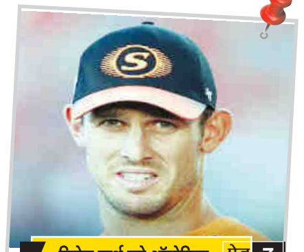
मिचेल मार्श बने ऑस्ट्रेलिया... पेज 7