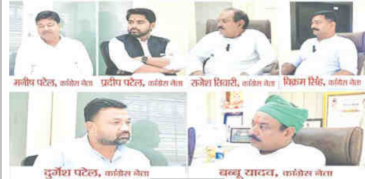
जबलपुर ● यशभारत yashbharat.co.in