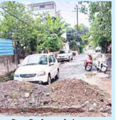
पुलिया निर्माण कार्य छोड़ा अधूरा, रहवासी निकलें तो निकलें कहा से...

रविकिरण सोसायटी के पास के रहवासी इन दिनों टेकेदार की लापरवाही से बहुत परेशान हैं क्योंकि यहां पर पिछले दस दिनों से टेकेदार ने कर्मचारियों के साथ मिलकर कॉलोनी में पुलिया को खोदकर छोड़ दिया है जिससे आवागमन में भी क्षेत्रीय रहवासियों को परेशानी हो रही है। क्षेत्रीय रहवासियों का कहना है कि टेकेदार के कमीशन के चक्कर में खामियाजा उन्हें भुगतना पड़ रहा है।