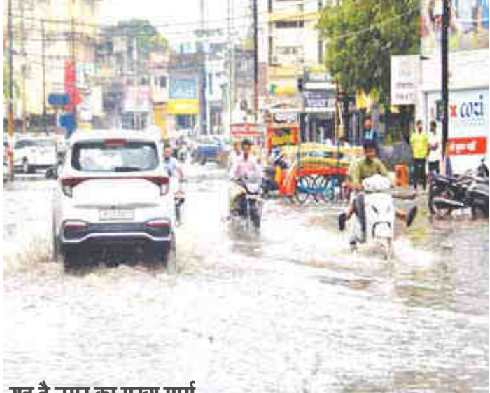
यह है नगर का मुख्य मार्ग

जबलपुर, यशभारत। शहरवासियों और जिले के रहवासियों के लिए बारिश के काले बादल थमे नहीं हैं। निचले इलाकों और शहर में कई जगह हो रहे जलप्लावन की समस्या और बढ़ने वाली है क्योंकि मौसम वैज्ञानिकों ने आने वाले दिनों में जबलपुर और उसके आसपास इलाकों में अतिभारी वर्षा का ऑरेंज अलर्ट जारी कर दिया गया है। करीब 10 दिनों के अंतराल के बाद बीते 2 दिन से शहर में ही रही लगातार बारिश ने पीडब्ल्यूडी विभाग, एनसीसी कंपनी और नगर निगम की कार्यप्रणाली की एक पोल फिर से खोली जिसका खामियाजा लोगों और राहगीरों को भुगतना पड़ा। शहर की कई मुख्य सड़कें तालाब के रूप में तब्दील हुईं तो निचले इलाकों के रहवासी अपने-अपने घरों में घुसे पानी को बाहर फेंकते नजर आए। सावन के अंतिम दौर में मानसून पूरी तरह से सक्रिय हो चुका है। पिछले 24 घंटों में शनिवार सुबह तक साढ़े तीन इंच से ज्यादा वर्षा दर्ज की गई है। इस सीजन में अब तक कुल 1087.5