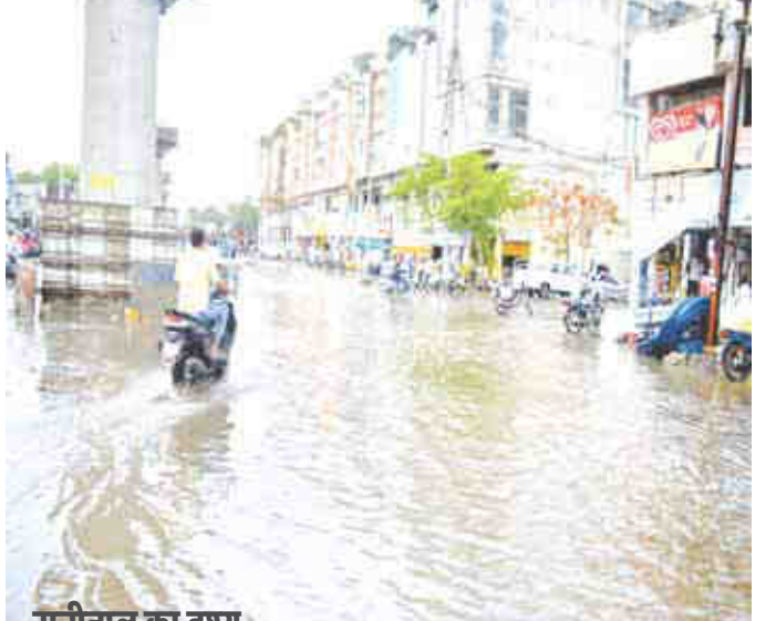
राजीताल का दृश्य