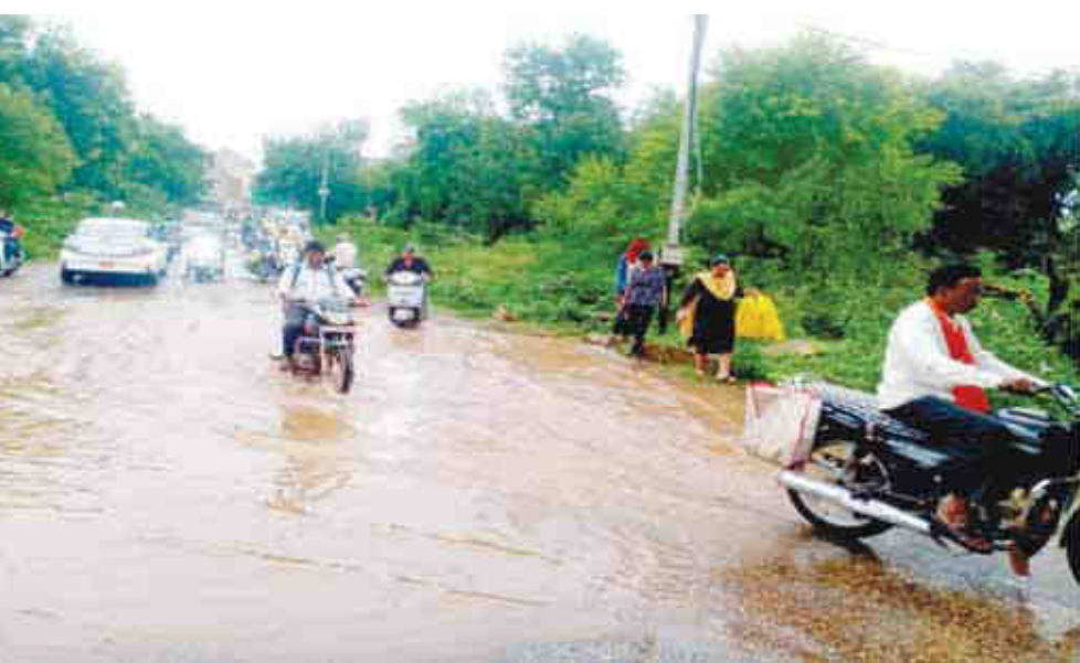
जबलपुर, सिवनी, बालाघाट, पन्ना, दमोह, छतरपुर, नर्मदापुरम, बैतूल जिलों में अति भारी बारिश का ऑरेंज अलर्ट जारी किया है। दूसरी ओर, सिंगरौली, सीधो, रीवा, सतना, अनूपपुर, उमरिया, शहडोल, कटनी, नरसिंहपुर, छिंदवाड़ा, मंडला, सागर, टीकमगाढ़, निवाड़ी, विदिशा, रायसेन, सीहोर, भोपाल, हरदा, बुरखानपुर, खंडवा, राजापूर, देवास, अशोकनगर, पिण्ड, दतिया जिलों में मध्यम से भारी बारिश का यलो अलर्ट जारी किया है।

कटनी, यशभारत। कटनी जिले में बीते 24 घंटे से फिर मानसून ने सक्रिय होकर पूरे जिले को पानी से तरबतर कर दिया है। बंगाल की खाड़ी में बने कम दबाव के क्षेत्र के कारण प्रदेश में शिथिल पड़ मानसून फिर सक्रिय हो गया है। इसके चलते शुक्रवार से अलग-अलग क्षेत्रों में रुक-रुककर बारिश का सिलसिला शुरू हो गया है। मौसम विज्ञानियों के मुताबिक बारिश का दौर अभी जारी रहने की संभावना है। प्रदेश में शनिवार को भी जबलपुर, शहडोल, रीवा, सागर, भोपाल, इंदौर, उज्जैन, नर्मदापुरम, ग्वालियर संभाग के जिलों में रुक-रुककर बारिश होगी। कटनी, उमरिया, शहडोल, जबलपुर, सागर, नर्मदापुरम संभाग के जिलों में कहीं-कहीं भारी बारिश भी हो सकती है। मौसम विज्ञान केंद्र के मुताबिक वर्तमान में बंगाल की खाड़ी में बंगाल एवं उससे लगे उत्तरी ओडिशा के तट पर एक कम दबाव का क्षेत्र बना हुआ है। यह मौसम प्रणाली पश्चिम-उत्तर-पश्चिम दिशा में छत्तीसगढ़ की तरफ आगे बढ़ेगी। पूर्वी उत्तर प्रदेश पर भी हवा के ऊपरी भाग में एक चक्रवात बना हुआ है। पंजाब और उसके आसपास एक पश्चिमी विक्षोभ ट्रेंगिका के रूप में बना हुआ है।