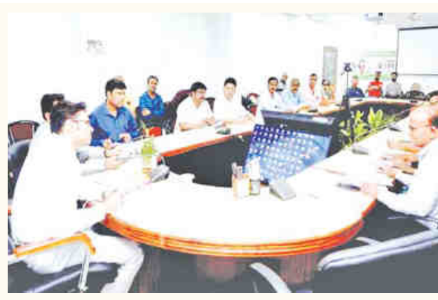
कारितलाई, इटौर, कांटी, शासकीय हाई स्कूल हदरहटा, पिपरिया सहलावन, पडचुरी, उबरा, भूला शासकीय उच्चतर माध्यमिक विद्यालय कटनी उमरियापान, भदौरा नंबर 1, हरदुआ, तेवरी, बसाडी, निटर्स, पिपरिध, शासकीय हाई स्कूल देवरी मवई, पोडीकला बी, बिचुआ कटनी, झिरी, गुड्डा, शासकीय उच्चतर माध्यमिक विद्यालय मुरवारी, खिरवाटोला, बरहटा, गैतलाई, पिपरिध, हथकुरी का नाम शामिल है। जारी कारण बताओ नोटिस में इन सभी प्राचार्यों व प्रभारी प्राचार्यों से मागे गये जवाब में कहा गया है कि समाधानकारक जवाब नहीं पाये जाने पर अनुशासनात्मक कार्यवाही की जायेगी।