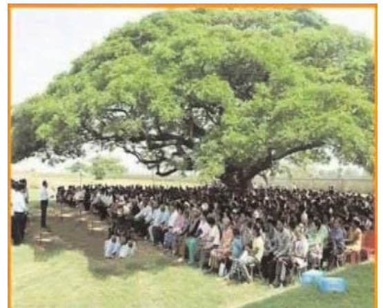
सोशल मीडिया पर जमकर वायरल हो रहा पेड़ पौधों की अहमियत बताने वाला छायाचित्र। जिससे लोग प्रेरित हो रहे हैं।

सालगिरह भी मनाई जा रही है। इन दिनों शहर के लोग जन्मदिन और शादी की सालगिरह के मौके पर पौधारोपण करना पसंद कर रहे हैं। इसके लिए लोगों को कहीं बाहर जाने की जरूरत नहीं है। घर के आसपास अच्छी जगह को तलाश कर वहां पर पौधे लगाए जा रहे हैं, पौधे लगाकर भी लोग अपनी खुशी का इजहार कर रहे हैं। कोरोना के दौरान यह भी एक तरीका सामने आया है सेलिब्रेशन का महत्व समझ में आ रहा है। तब लोग और अधिक मात्रा में पौधों का रोपण कर रहे हैं। सिर्फ इन्हें लगाना ही नहीं बल्कि इनको देखरेख करना भी हमारी जिम्मेदारी है इस बात को स्वीकारते हुए लोग इन दिनों पौधारोपण कर रहे हैं। शादी का सीजन चल रहा है तो लोगों की