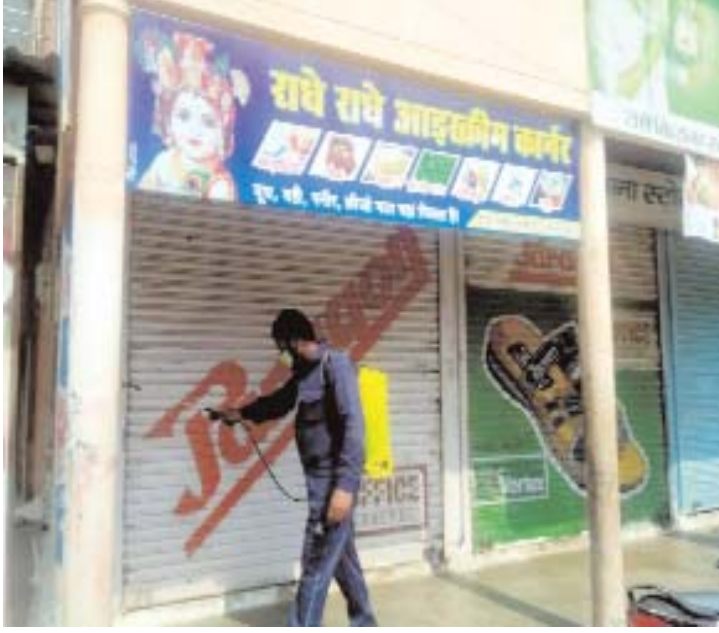
निर्धारित मानक की पॉलीथिन उपलब्ध कराने, नगर की सुचारू सफाई व्यवस्था कराई जाकर कीटनाशक दवा का छिड़काव कराने सहित नागरिकों के स्वास्थ्य की चिंता करते हुए स्वच्छ पानी की उपलब्धता हेतु पेयजल की पानी की टंकियों की सफाई की जाकर ब्लीचिंग पाउडर के छिड़काव का कार्य कराया जा रहा है।