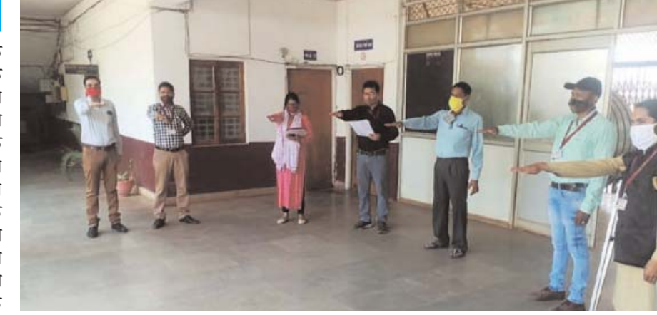
आतंकवाद विरोधी दिवस पर दिलाई गई शपथ