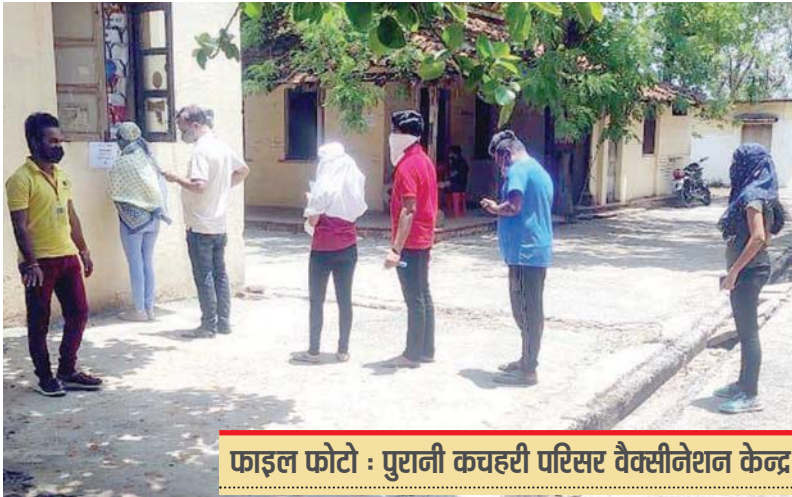
फाइल फोटो : पुरानी कचहरी परिसर वैक्सीनेशन केन्द्र

को तारीख, समय और टीकाकरण केन्द्र की जानकारी मैसेज के माध्यम से दी जाती थी। टीकों के खराब होने की खबरें आ रही थीं। इसके अलावा बुकिंग होने के बाद किसी अन्य व्यक्ति