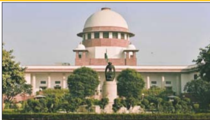
पीठ ने आरोपी जवान को सवाल किया कि रात के आठ बजे पीड़िता आरोपी से मिलने होटल के कमरे में क्यों गई? इस पर वकील ने कहा कि शिकायतकर्ता और आरोपी पहले से एक-दूसरे से परिचित थे। उन्होंने दावा किया कि होटल में चाय में नशीला पदार्थ मिलाकर उसे पिलाया गया और इसके बाद दुष्कर्म किया। आरोपी की अप्रिम जमानत याचिका का विरोध करते हुए यह भी कहा कि उसने शादी का झांसा देकर

नई दिल्ली। सुप्रीम कोर्ट ने दुष्कर्म के आरोपी सेना के एक जवान को यह कहते हुए गिरफ्तारी से राहत दे दी कि आखिर पीड़िता रात आठ बजे आरोपी से मिलने होटल के कमरे में क्यों गई? यह जवान अभी जम्मू-कश्मीर में तैनात है। जस्टिस विनोय शरण और जस्टिस बीआर गवई की पीठ ने आरोपी जवान द्वारा दायर अप्रिम जमानत की याचिका पर सुनवाई करते हुए पाया कि आरोपी और शिकायतकर्ता के बीच पहले से संबंध थे। पीठ ने पीड़िता के वकील से सवाल किया कि रात के आठ बजे पीड़िता आरोपी से मिलने होटल के कमरे में क्यों गई? इस पर वकील ने कहा कि शिकायतकर्ता और आरोपी पहले से एक-दूसरे से परिचित थे। उन्होंने दावा किया कि होटल में चाय में नशीला पदार्थ मिलाकर उसे पिलाया गया और इसके बाद दुष्कर्म किया। आरोपी की अप्रिम जमानत याचिका का विरोध करते हुए यह भी कहा कि उसने शादी का झांसा देकर