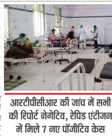
आरटीपीसीआर की जांच में सभी की रिपोर्ट नेगेटिव, रेपिड एंटीजन में मिले 7 नए पॉजिटिव केस

कटनी। जिले में कोरोना संक्रमण की रफतार कम होने के साथ अब सेमलिंग भी कम हो गई है। तीन दिन पहले तक जहां जिले में एक हजार से ज्यादा लोगों की सेमलिंग होती थी तो वहीं दो दिन से यह आंकड़ा 600 के आसपास हो गया है। सेमलिंग कम होने के पीछे स्वास्थ्य विभाग का कहना है कि अब कम ही लोग सेमलिंग कराने के लिए आ रहे हैं। शहर में अभी भी रेपिड एंटीजन टेस्ट और ग्रामीण क्षेत्रों में आरटीपीसीआर से कोरोना के संदिग्ध मरीजों की जांच की जा रही है। इसके अलावा गांव-गांव स्वास्थ्य विभाग की टीम भ्रमण करते हुए लोगों की सेमलिंग कर रही है। सेमलिंग कम होने के साथ ही आज लगातार दूसरे दिन जिले में संक्रमण 1.14 प्रतिशत रही। इन 7 पॉजिटिव केस को मिलाकर जिले में कुल संक्रमित मरीजों की संख्या 9 हजार 340 हो गई है।