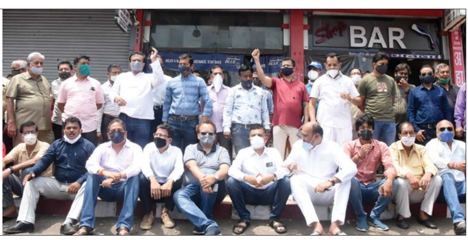
फुहारा के बाद सदर व्यापारी दुकान खोलने को लेकर लामबंद

कलेक्टर द्वारा कोरोना के मामलों में आई गिरावट के लिए जनता के सहयोग का धन्यवाद दिया। साथ ही उनसे आवाहन किया कि अभी कुछ दिन और सतर्कता और संयम से काम लें क्योंकि अभी भी लगभग 100 मामले प्रतिदिन आ रहे हैं और यदि हमने सतर्कता नहीं बरती तो हम फिर से पुरानी स्थिति में लौट आएंगे। उन्होंने आवाहन किया कि हमारे द्वारा दिखाया गया संयम हमें आने वाले समय में राहत देगा साथ ही धीरे धीरे सभी गतिविधियों को खोलने का मौका भी देगा। यदि जरा भी लापरवाही की तो हम फिर पुरानी स्थिति में आ जाएंगे।