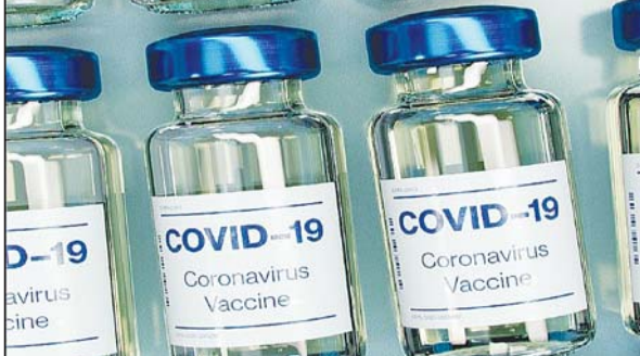
स्थानीय स्वयंसेवकों पर टीके की प्रभावकारिता और सुरक्षा को परखा जाता है, जिससे अब कंपनियों को छूट मिल गई है।

भारतीय दवा नियामक कंपनी यानी डीसीजीआई ने अब फाइजर और मॉडर्ना कंपनी को जल्द से जल्द भारत लाने के लिए इनके अलग से ट्रायल करने की शर्तों को हटा दिया है। आसान भाषा में समझें तो जिन वैक्सिन को अमेरिकी एफडीए और विश्व स्वास्थ्य संगठन से आपातकालीन इस्तेमाल की मंजूरी मिल गई है, उन्हें भारत में अलग से ट्रायल प्रक्रिया से नहीं गुजरना होगा। बता दें कि अभी तक किसी भी विदेशी कंपनी को भारत में कोरोना वायरस रोधी टीका शुरू करने से पहले ब्रिजिंग ट्रायल करना होता था। इसमें सीमित संख्या में