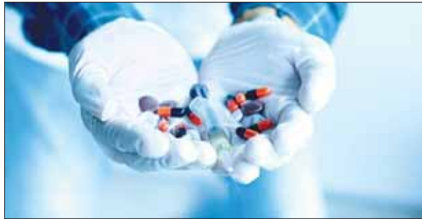
डायरेक्टर जनरल ऑफ हेल्थ सर्विसेज ( डीजीएचएस) ने नई गाइडलाइंस के तहत एस्पिर्मोमेटिक मरीजों के इलाज में इस्तेमाल की जा रही सभी दवाओं को लिस्ट से हटा दिया है। गाइडलाइन में कहा गया है कि ऐसे

केंद्र सरकार की ओर से जारी नई गाइडलाइंस के मुताबिक, जिन मरीजों में कोरोना संक्रमण के लक्षण नजर नहीं आते या हल्के लक्षण हैं, उन्हें किसी तरह की दवाइयों लेने की जरूरत नहीं है। हालांकि, दूसरी बीमारियों को जो दवाएं चल रही हैं, उन्हें जारी रखना चाहिए। ऐसे मरीजों को टेले कॉन्सल्टेशन ( वीडियो के जरिए उपचार) लेना चाहिए। अच्छी डाइट लेनी चाहिए। साथ ही मास्क, सोशल डिस्टेंसिंग जैसे जरूरी कोरोना नियमों का पालन करना चाहिए।