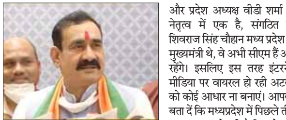
और प्रदेश अध्यक्ष बीडी शर्मा के नेतृत्व में एक है, संगठित है। शिवराज सिंह चौहान मध्य प्रदेश के मुख्यमंत्री थे, वे अभी सीएम हैं और रहेंगे। इसलिए इस तरह इंटरनेट मीडिया पर वायरल हो रही अटकलों को कोई आधार ना बनाए। आपको बता दें कि मध्यप्रदेश में पिछले तीन चार दिनों से यह खबर वायरल हो रही है कि प्रदेश में सीएम बदलने वाले हैं साथ ही बीडी शर्मा मुख्यमंत्री बन सकते हैं आदि, आदि।

एम्पी में नेतृत्व परिवर्तन को लेकर चल रही खबरों को मंत्री नरोत्तम मिश्रा ने बताया अफवाह