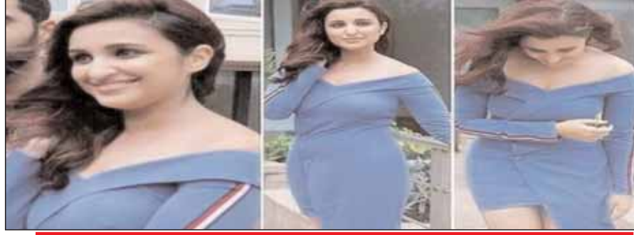
परिणीति चोपड़ा ने फिल्मों में अपने लव मैकिंग सीन को लेकर दिया बयान, कहा- ऐसे सीन में कट का मतलब...

बॉलीवुड अभिनेत्री परिणीति चोपड़ा फिल्मों के अलावा निजी जिंदगी और करियर के बारे में खुलासा करती रहती हैं। वह अक्सर सोशल मीडिया और इंटरव्यू के जरिए अपने बारे में खास खुलासे करती रहती हैं। अब परिणीति चोपड़ा ने अपने फिल्मी करियर को लेकर खास बात कही है।