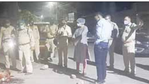
मृतक के जीवित अवस्था का चित्र, जांच पड़ताल में जुटी पुलिस