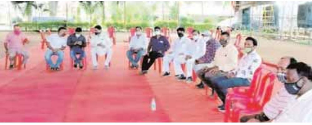
इनकी रही उपस्थिति

कटनी। कोरोना संक्रमण ने टेंट व्यवसाय को पूरी तरह चौपट कर दिया है। चार महीने के सीजन से होने वाली आय से पूरे साल गुजर-बसर करने वाले टेंट व्यवसायियों की आर्थिक हालत अब दयनीय होती जा रही है। शहर में कुछ ऐसे भी टेंट व्यवसायी हैं, जिनकी रोजी-रोटी इसी से चलती है लेकिन कोरोना संक्रमण की वजह से अब इनको कई तरह की परेशानियों का सामना करना पड़ रहा है। शादियों के अलावा साल भर होने वाले छोटे कार्यक्रमों से इनका गुजारा चलता था लेकिन संक्रमण की वजह से अब ऐसे कार्यक्रम भी नहीं हो रहे हैं। राज्य सरकार द्वारा अनलॉक के लिए जारी की गई गाइडलाइन में शादियों में 20 लोगों की अनुमति दी गई है। जिससे शहर के टेंट व्यवसायियों में रोष व्याप्त है। कल गुरुवार को दिव्यांचल मैरिज गार्डन में फैडरेशन ऑफ मध्यप्रदेश टेंट एसोसिएशन की एक बैठक आयोजित की गई। जिसमें टेंट व्यापारियों के अलावा शहर के प्रबुद्ध नागरिकों की उपस्थिति रही। बैठक में टेंट व्यवसायियों ने कहा कि अब जब पूरे प्रदेश के साथ ही कटनी जिले में भी संक्रमण की रफ्तार थम गई है और सभी तरह के व्यवसायों को लगातार छूट प्रदान की जा रही है, तब इन स्थितियों में राज्य सरकार को नई गाइडलाइन जारी करते हुए कम से कम 200 लोगों की अनुमति दी जानी चाहिए। बैठक में निर्णय