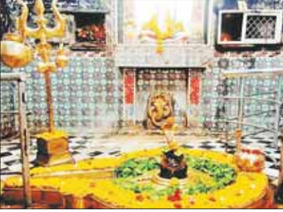
वर्ष- 15 अंक-135 • कटनी • गुठवार, 17 जून, 2021 • मूल्य- 2 रुपए • पृष्ठ-8 • ज्येष्ठ शुक्ल पक्ष - 7 • विक्रम संवत् 2078 शके 1935