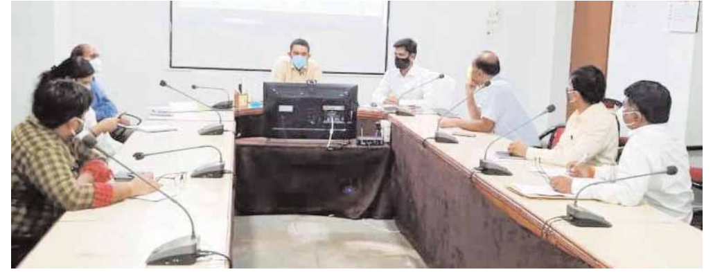
टीकाकरण दल के साथ रिजर्व टीम भी शामिल

कटनी। जिले में 21 जून से कोरोना वैक्सीनेशन का महाअभियान प्रारंभ होगा। इस महाअभियान में अधिक से अधिक लोग शामिल हों, और कोरोना संक्रमण से बचाव के लिये टीकाकरण कराएँ, इस उद्देश्य से जिले में इसके प्रभावी क्रियान्वयन की तैयारियाँ प्रारंभ कर दी गई हैं। गुरुवार को कलेक्टर सभाकक्ष में कलेक्टर प्रियंक मिश्रा ने वैक्सीनेशन महाअभियान की तैयारियों की समीक्षा की। इस दौरान उन्होंने विस्तार से अभियान को सफल बनाने के लिये आवश्यक दिशा-निर्देश भी संबंधित अधिकारियों को दिये। उन्होंने कहा कि इस अभियान की सफलता के लिये पूरी टीम जुटकर मुस्तैदी से कार्य करे। किसी भी प्रकार की कोताही इसमें बर्दाश नहीं की जायेगी। बैठक में कलेक्टर ने मुख्य चिकित्सा एवं स्वास्थ्य अधिकारी के साथ ही सीईओ जिला पंचायत और नगर निगम आयुक्त को शहरी और ग्रामीण क्षेत्र के लिये सुव्यवस्थित टीकाकरण की कार्ययोजना तैयार करने के निर्देश दिये। उन्होंने कहा कि टीकाकरण केन्द्रों का चयन शीघ्र करें। टीकाकरण केन्द्रों में बेहतर व्यवस्थाएँ हों, इसका ध्यान रखें। सरत, अर्बन के साथ ही 21 जून को स्पेशल टीकाकरण कैम्प का भी आयोजन किया जाये। जिसमें उच्च जोखिम वर्ग के लोगों का वैक्सीनेशन कार्य हो।