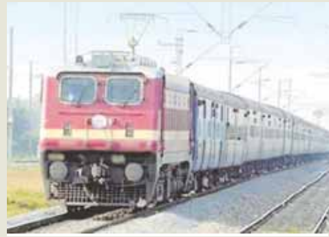
कोरोना काल के दौरान बदली परिस्थितियों को देखते हुए रेलवे कई नियमित ट्रेनों के समय और रूट में बदलाव कर सकता है। यह बदलाव करने से पहले सर्वे का अध्ययन किया जाएगा।

कई ट्रेनों के समय व रूट में बदलाव भी कर सकता है रेलवे