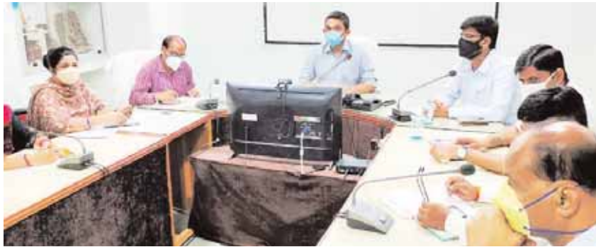
कोरोना से बचाव का उपाय टीकाकरण

कटनी। 21 जून से जिले में कोरोना टीकाकरण का महा अभियान प्रारंभ होगा। जिले में इलेक्शन पैटर्न पर तैयारियों को जा रही है। टीकाकरण केन्द्रों की स्थापना की जा रही है। अधिक से अधिक लोग इस महा अभियान में शामिल होकर टीकाकरण कराएँ, इसके लिये जिला प्रशासन द्वारा मुस्तीदी से काम किया जा रहा है। ग्रामीण क्षेत्रों में आयोजित होने वाले टीकाकरण शिविर सफल हों, इसके लिये पूर्व की तैयारियों की समीक्षा कलेक्टर प्रियंक मिश्रा ने शुरुवार को की। कलेक्टर सभाकक्ष में आयोजित समीक्षा बैठक में श्री मिश्रा ने कहा कि सभी लोग टीम के रूप में जुटकर काम करें। यह कार्य सामाजिक कार्य है। इसमें अधिक से अधिक लोगों को जोड़ें। जिलास्तरीय संकट प्रबंधन समूह के द्वारा किये जाने वाले कार्यों के विषय में कलेक्टर ने विस्तार से बताया। उन्होंने कहा कि ग्रामस्तरीय और ब्लॉकस्तरीय संकट प्रबंधन समूह की जवाबदेही इस कार्य में बहुत महत्वपूर्ण है। सभी एसडीएम और सीईओ जनपद अपने ब्लॉक और ग्रामस्तरीय संकट प्रबंधन समूहों को सक्रिय करें और तत्परता के साथ 21 जून से प्रारंभ होने जा रहे कोरोना वैक्सीनेशन के महा अभियान में कार्य करें। उन्होंने कहा कि इस अभियान के माध्यम से हम लोगों में टीकाकरण को लेकर व्यास समस्त भावितियों को दूर करें। इसका अधिक से अधिक प्रचार-प्रसार करें। ग्राम पंचायत स्तर पर डोर-टू-डोर कैम्पेन चलायें। टीकाकरण केन्द्रों में साफसफाई रहे, इसके लिये भी आयुक्त नगर निगम और सीईओ जनपदों को कलेक्टर ने निर्देशित किया। उन्होंने कहा कि एसडीएम वैक्सीन प्रेरकों के साथ बैठक कर लें। जनजागरूकता के लिये स्वसहायता समूहों की सदस्यों और जन अभियान परिषद के वॉलेन्टियर्स को जोड़ा जाये।