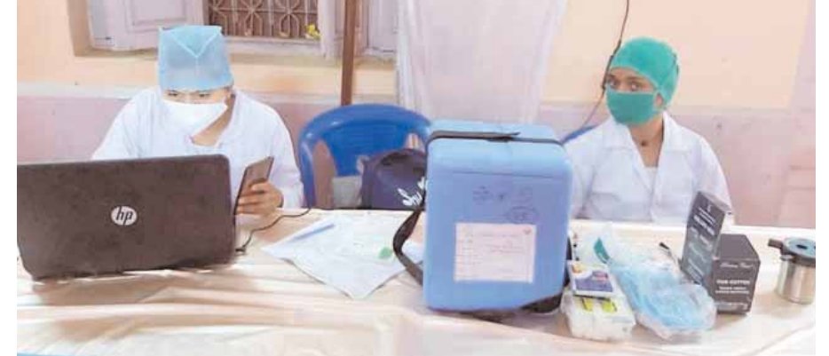
वैक्सीनेशन के साथ सेम्पलिंग

कटनी। कोरोना महामारी से बचाव के लिए पूरे प्रदेश के साथ ही कटनी जिले में भी आज से कोरोना वैक्सीन महा-अभियान की शुरुआत हुई। महा-अभियान को लेकर जिले में खासा उत्साह देखा गया। वैक्सीन लगवाने के लिए सुबह से ही केन्द्रों में बड़ी संख्या में लोग पहुंच रहे थे। कई केन्द्रों में लोगों की कतार भी देखी गई। भीषण गर्मी और उमस के बावजूद लोगों में वैक्सीन लगवाने के लिए गजब का उत्साह देखा गया। जिला चिकित्सालय के साथ ही पुरानी कचहरी परिसर और केसीएस स्कूल में बनाए गए टीकाकरण केन्द्रों को गुब्बारों से सजाया गया था। यहां रंगोली भी बनाई गई थी। वैक्सीन लगवाने के लिए लोगों को प्रेरित किया जा रहा था। इसकी जिम्मेदारी प्रेरकों को सौंपी गई थी। प्रेरकों ने शहर से लेकर गांव-गांव तक लोगों को टीका लगवाने के लिए प्रेरित किया। यही कारण था कि सुबह के पहले घंटे 2138 लोगों ने टीका लगवा लिया था। विदित हो कि वैक्सीन महा-अभियान के अंतर्गत जिले में 128 केन्द्र बनाए गए थे, जहां कोवीशील्ड और को-वैक्सीन की पहली और दूरी डोज लगाई जा रही थी। शहर के साथ ही ग्रामीण अंचल क्षेत्रों में भी अभियान को लेकर लोगों में उत्साह देखा गया।