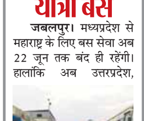
जबलपुर। मध्यप्रदेश से महाराष्ट्र के लिए बस सेवा अब 22 जून तक बंद ही रहेगी।

राजस्थान और छत्तीसगढ़ के लिए बसें शुरू हो चुकी हैं। महाराष्ट्र में कोरोना केस को देखते हुए परिवहन विभाग ने यात्री बसें पर रोक बढाई है। इससे पहले इन पर 22 जून तक रोक थी। इसके लिए विभाग ने मंगलवार को नए आदेश जारी कर दिए। इसमें कहा गया है, अब 22 जून तक महाराष्ट्र के लिए बस सेवाएं पूरी तरह बंद रहेंगी। न तो यहां से कोई बस मध्यप्रदेश में प्रवेश कर सकेगी और न ही यहां से कोई बस जाएगी। गत 16 जून से उत्तरप्रदेश, राजस्थान और छत्तीसगढ़ के लिए यात्री बसें का संचालन होना शुरू हो चुका था, लेकिन महाराष्ट्र के लिए 22 जून तक बस सेवा को प्रतिबंधित रखा था। नए आदेश के बाद अब महाराष्ट्र आने-जाने वालों का इंतजार और बढ़ गया है।