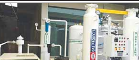
अस्पतालों में बेहतर सुविधा उपलब्ध कराने की तैयारी