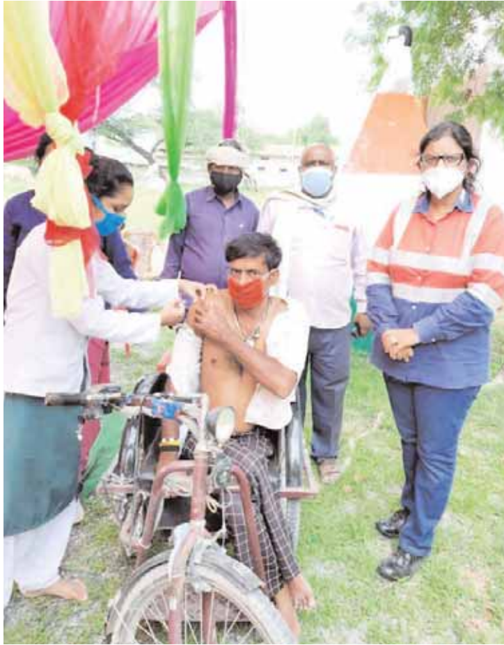
कटनी। अंतरराष्ट्रीय योग दिवस के अवसर पर 21 जून को राज्य में प्रारंभ हुए कोविड वैक्सिनेशन टीकाकरण महाअभियान के तहत कटनी जिले में राज्य शासन द्वारा सोमवार 21 जून को वृहद स्तर पर कोविड-19 टीकाकरण किया गया। इस महाअभियान के प्रथम दिवस पर पिछड़े