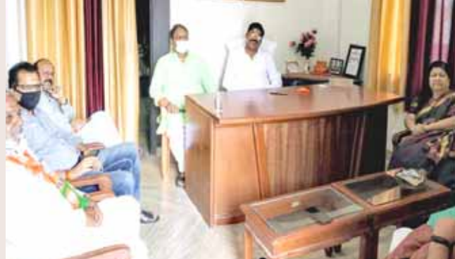
जिला कार्यकारिणी की घोषणा संबंधी चर्चाओं के बीच भाजपा जिला कार्यालय में आज श्यामप्रसाद मुखर्जी के बलिदान दिवस पर पुष्पस्मरण किया गया।

चाहतीए इसलिए फूंक फूंक कर कदम रखा जा रहा है। प्रदेश नेतृत्व को इस बात का भली भाँति अंदाजा है कि कार्यकारिणी की घोषणा के बाद यदि असंतोष के स्वर सुनाई दिए तो पूरे प्रदेश में इसका प्रतिकार असर जाएगा। कटनी से उठने वाले विद्रोह की चिंगारी अन्य जिलों को भी अपनी आगोश में ले सकती है। इसी वजह से कटनी से लेकर राजधानी तक इस मसले पर ताड़ा होमवर्क किया जा रहा है। भाजपाई गलियारों में व्याप्त चर्चा के मुताबिक