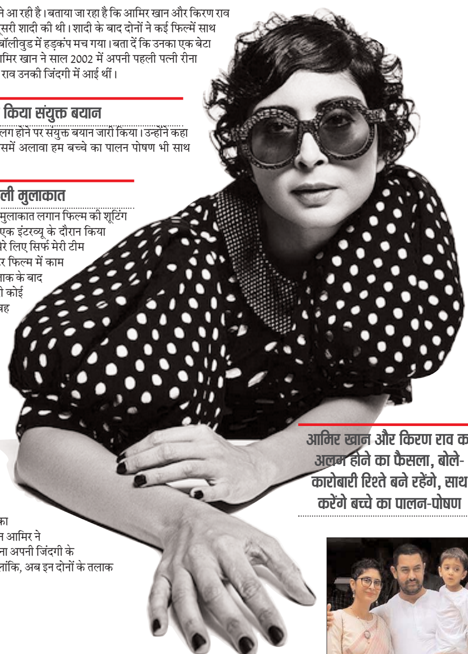
आमिर खान और किरण राव का अलग होने का फैसला, बोले-कारोबारी रिश्ते बने रहेंगे, साथ करेंगे बच्चे का पालन-पोषण

आमिर खान ने बताया था कि एक बार किरण ने उन्हें फोन किया। यह कॉल करीब 30 मिनट तक चली, जिसके बाद वह किरण को डेट करने लगे। करीब एक-दो साल तक हम ऐसे ही मिलते रहे और उसके बाद शादी करने का फैसला किया। इंटरव्यू के दौरान आमिर ने बताया था कि वह किरण के बिना अपनी जिंदगी के बारे में सोच भी नहीं सकते। हालांकि, अब इन दोनों के तलाक की खबर सामने आ गई है।