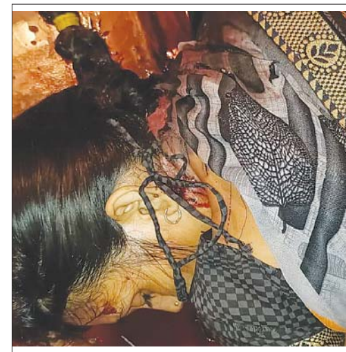
मौके पर बहू-ससुर का रक्तर्जित शव