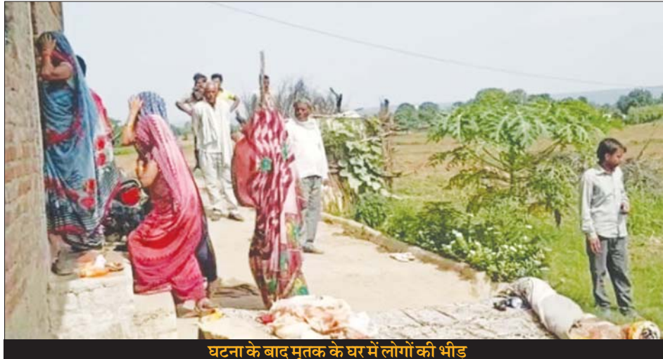
घटना के बाद मृतक के घर में लोगों की भीड़

गए। उसने कुल्हाड़ी उठाई और पिता के गर्दन पर ताबड़तोड़ वार कर मार डाला। इसके बाद पत्नी को भी इसी तरह बेरहमी से गर्दन