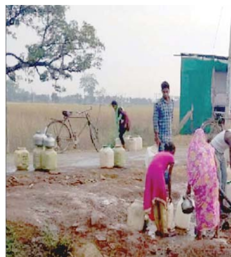
ससाह से यह समस्या है। पानी का इंतजाम करने के लिए काम-धंदा छोड़कर जुटना पड़ता है। सुबह होते ही लोग डिब्बा बाल्टी लेकर पानी के लिए कतारों में खड़े दिखाई पड़ते हैं। लोगों का कहना है कि पंचायत प्रतिनिधियों से कई बार कहा गया पर कोई सुनवाई ही नहीं हो रही। ग्रामीणों ने अब कलेक्टर से पेयजल संकट के निदान की मांग की है।

कैमोर पुलिस ने चंद घंटों में खोज निकाला लापता किशोरी को