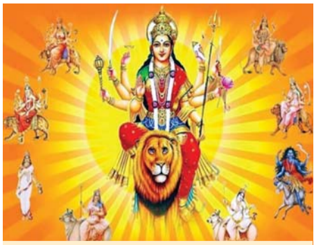
कार माह और चैत्र माह के अलावा दो और नवरात्रि गुप्त रूप से मनाई जाती हैं, जो आषाढ़ माह और माघ माहों में आती हैं। आज 11 जुलाई से गुप्त नवरात्रि की शुरुआत हो रही है।