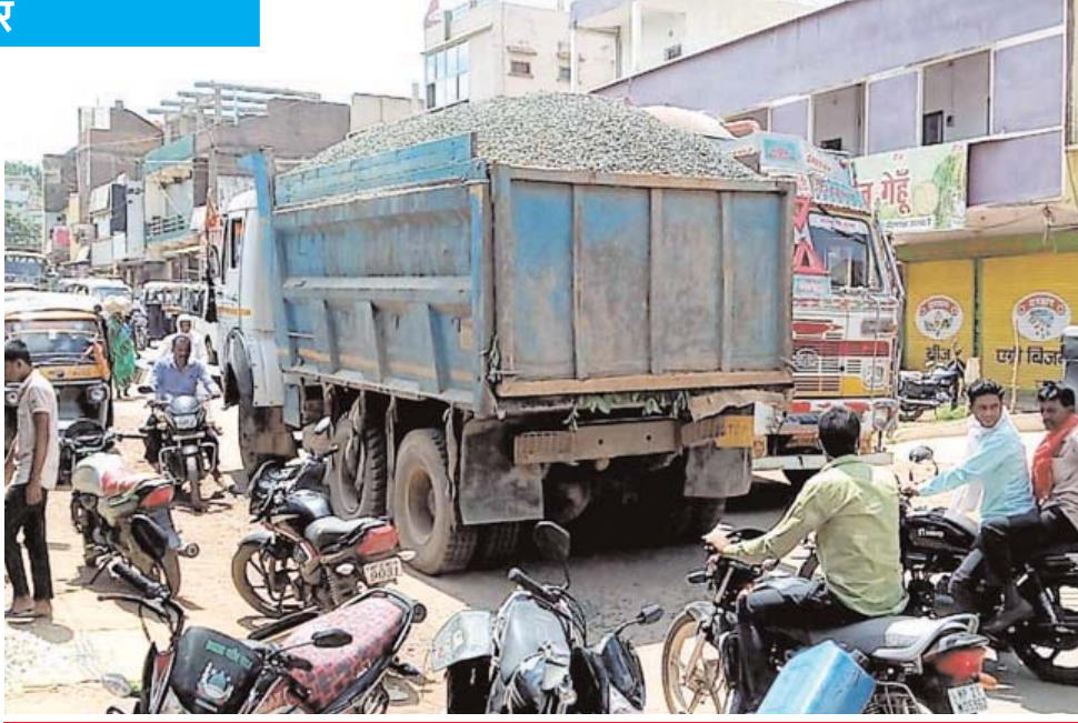
सड़क पर गिट्टी छलकाते बेखौफ गुजर रहे भारी वाहन, हद दर्ज की लापरवाही, मंडराता खतरा, खुली छूट

बरही। यह हद दर्ज की लापरवाही को बर्यां कर रही बोलती तस्वीर देखकर ही अंदाजा लगाया जा सकता है कि किस कदर नियम-कायदों को रौंदते हुए ओवरलोड ये भारी वाहनों से न सिर्फ दिनभर खतरा मंडराया रहता है बल्कि