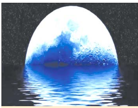
नासा ने कहा कि वर्ष 2030 में जलवायु परिवर्तन के चलते बढ़ते समुद्र के जलस्तर के साथ चांद अपनी कक्षा से डगमगाएगा, जिससे धरती पर विनाशकारी बाढ़ आएगी।