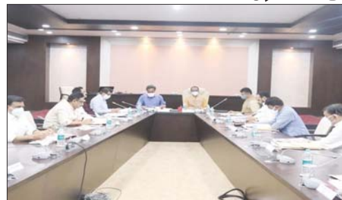
कैबिनेट में अन्य प्रस्तावों पर विचार करते निर्णय लिया जाएगा। सूत्रों के मुताबिक बैठक में मुख्यमंत्री

भोपाल। मध्य प्रदेश में सरकारी या निजी भूमि से खनिज परिवहन से पहले रायल्टी के बराबर राशि जमा करानी होगी। अभी तक शासकीय भूमि से प्राप्त होने वाले ऐसे खनिज की परिवहन अनुज्ञा जारी करने से पहले रायल्टी दर से दोगुनी के बराबर राशि जमा करनी होती थी। निजी भूमि के लिए रायल्टी के बराबर राशि जमा करने का प्रविधान था। मध्य प्रदेश गौण खनिज नियम में संशोधन से एकरूपता आ जाएगी। वहीं, भोपाल गैस पीड़ित कल्याणी विधवा को एक हजार रुपये मासिक अतिरिक्त पेंशन देने पर निर्णय लिया जा सकता है। यह पेंशन सामाजिक सुरक्षा पेंशन से अतिरिक्त होगी। इसके अलावा