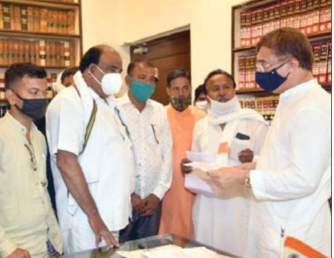
तन्खा से कही। याकूब अंसारी, अजाय राईन के नेतृत्व में क्षेत्रीय निवासियों ने राज्यसभा सांसद को अमखेरा से लेकर खजरी बायपास तक के मार्ग की वास्तुस्थिति से राज्यसभा सांसद को अवगत कराया। राज्यसभा सांसद विवेक कृष्ण तन्खा ने तत्काल संभागीय आयुक्त को पत्र लिखा कर शहर व ग्रामीण जनता की अत्यंत जन समस्या को

जबलपुर। अमखेरा से लेकर खजरी बायपास तक का रास्ता आज यहां से गुजरने वाले हजारों रहवासियों के लिये काल बना हुआ है। घंटिया सड़क के चलते बीते कुछ हफ्तों में दर्जनों लोगों की सड़क हादसे में मौत इस मार्ग पर हुई है। वहीं सैकड़ों लोग घायल हुये हैं। इस मार्ग का सड़क निर्माण वर्षों से प्रस्तावित एवं पास है। दर्जनों धरने लेकिन आज तक शासन प्रशासन के कान में जूं नहीं रेंगी और सड़क का काम शुरु नहीं हो सका। जिसका खामियाजा आमजनता भुगत रही है। यह बात समाजसेवी याकूब अंसारी ने राज्यसभा सांसद विवेक कृष्ण