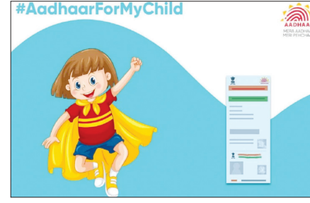
है तो आप उसके लिए बाल आधार बनवा सकते हैं। बच्चों के लिए जारी किया जाने वाला आधार नीले रंग का होता है। बाल आधार के लिए जहां कहीं भी बच्चे की पहचान की जरूरत होती है, वहां उसके माता-पिता को साथ जाना होता है। लेकिन बच्चे के पांच वर्ष के होने पर उसे अपने

वेब डेस्क। प्रत्येक भारतीय नागरिक के लिए आधार कार्ड महत्वपूर्ण दस्तावेज है। आधार कार्ड केवल एक दस्तावेज ही नहीं है, बल्कि पहचान पत्र है। किसी भी वित्तीय लेनदेन और सरकारी योजनाओं का लाभ उठाने के लिए आधार बेहद जरूरी है। आधार में न सिर्फ आपके पते की जानकारी होती है, बल्कि इसमें व्यक्ति की बायोमेट्रिक जानकारी भी होती है। आधार कार्ड जारी करने वाली संस्था भारतीय विशिष्ट पहचान प्राधिकरण बच्चों के आधार बनवाने की सुविधा भी देती है। आपको अपने बच्चों के लिए बाल आधार बनवाना होता है। यदि आपका बच्चा पांच साल से कम उम्र का