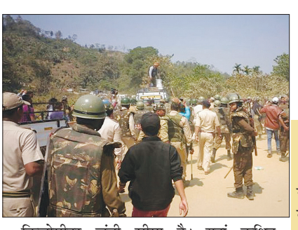
किलोमीटर लंबी सीमा है। यहां कथित अतिक्रमण को लेकर स्थानीय लोगों और सीमा सुरक्षा बलों के बीच झड़पें होती रहती हैं। असम के बराक घाटी के जिले कछार, कमीगंज और हैलाकांडी, तो मिजोरम के तीन जिलों आइजोल, ओलासिब और ममित की 164 किलोमीटर लंबी सीमा जुड़ी हुई है। केंद्र सरकार कर रही शांति के प्रयास केंद्रीय गृह मंत्री अमित शाह ने असम और मिजोरम के मुख्यमंत्रियों, हिमंत बिस्वा सरमा

नई दिल्ली। असम और मिजोरम को लेकर सीमा विवाद गहराता जा रहा है। सोमवार को यहां दोनों पक्षों में हिंसक झड़प हुई थी और असम पुलिस के 6 जवानों की मौत हो गई थी। दोनों सरकारें इस हिंसा के लिए एक दूसरे को जिम्मेदार ठहरा रही हैं। इस बीच, विपक्ष ने पूरे मामले पर राजनीति शुरू कर दी है। कांग्रेस नेता ने हिंसा के लिए केंद्र सरकार को जिम्मेदार ठहराते हुए केंद्रीय गृहमंत्री अमित शाह पर निशाना साधा। एआईएमआईएम सांसद असदुद्दीन औवैसी ने भी केंद्र पर हमला बोला। वहीं केंद्र ने 7 सदस्यीय कमेटी गठित की है जो सोनिया गांधी को अपनी रिपोर्ट सौंपेगी।