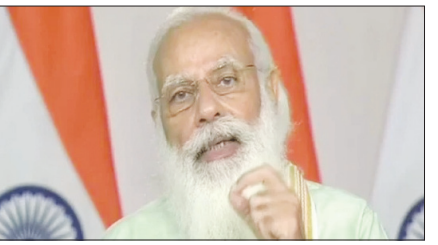
मुताबिक प्रधानमंत्री ने पार्टी सांसदों से कहा कि वे संसद में विपक्षी दलों के रवैये के बारे में जनता को अवगत कराएं और उन्हें बताएं कि सरकार सभी मुद्दों पर बहस के लिए तैयार है किंतु विपक्षी दल इससे भाग रहे हैं और हंगामा कर रहे हैं। बैठक के बाद पत्रकारों को संबोधित करते हुए संसदीय कार्य राज्य मंत्री अर्जुन राम मेघवाल ने बताया कि बैठक को संबोधित करते हुए प्रधानमंत्री मोदी ने कहा, आजादी का अमृत महोत्सव केवल सरकारी कार्यक्रम नहीं है। यह जन आंदोलन के रूप में होना चाहिए.. जन भागीदारी के साथ हमें आगे बढ़ना है। मेघवाल के मुताबिक प्रधानमंत्री ने कहा कि देश की आजादी के लिए कई लोगों ने अपनी कुर्बानी दी लेकिन हमें जनता को समझाना है कि क्या हम देश के लिए जी सकते हैं।

नई दिल्ली। संसद शुरू होने से पहले भाजपा संसदीय दल की बैठक हुई। बैठक में पीएम मोदी ने अपने सांसदों से गांवों में जाकर देश की उपलब्धियां बताने का आग्रह किया। पीएम मोदी ने 75 साल पूरे होने पर 75 गांवों में सांसदों को जाने की अपील की। इस दौरान पीएम मोदी ने दूसरे हफ्ते संसद की कार्यवाही बाधित होने को लेकर कांग्रेस पर जमकर निशाना साधा। पीएम मोदी ने कहा कि कांग्रेस ना सदन चलने देती है और ना चर्चा होने देती है। पीएम मोदी ने कहा कि पिछले दिनों वैक्सिनेशन को लेकर सर्वदलीय बैठक बुलाई गई थी उसमें भी कांग्रेस शामिल नहीं हुई। कांग्रेस बैठकों का लगातार बहिष्कार कर रहे हैं। प्रधानमंत्री ने कहा कि आजादी की 75वीं वर्षगांठ के मौके पर मनया जाने वाला अमृत महोत्सव केवल एक सरकारी कार्यक्रम बनकर नहीं रहना चाहिए बल्कि इसे जन आंदोलन के रूप में आगे बढ़ाने के लिए जन सहभागिता सुनिश्चित करनी होगी। प्रधानमंत्री ने पार्टी सांसदों से अपील की कि वे प्रत्येक विधानसभा क्षेत्र में दो-दो कार्यक्रमों की टोली तैयार करें जो 75 गांवों का दौरा करें और वहां 75 दिन बिताएं तथा जनता के बीच डिजिटल साक्षरता को लेकर जागरूकता अभियान चलाएं। सूचों के