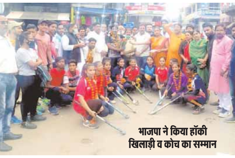
भाजपा ने किया हॉकी खिलाड़ी व कोच का सम्मान