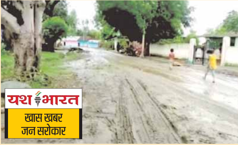
यश भारत खास खबर जन सरोकार