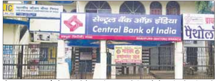
सेंट्रल बैंक का शहपुरा में कोरोना मरीज मिलने से हड़कंप मच गया है। बैंक के समस्त ग्राहक एवं कर्मचारी अधिकारी की आवाजाही पर रोक लगा दिया गया है। बैंक के समस्त अधिकारी कर्मचारियों का संचालन शुरू करने का निर्णय लिया है। ड्राइविंग कोच में 55 सीट तो ट्रेलर वाले में 84 सीट होती है। 8 कोच वाले मेमू में 650 यात्री सीट पर बैठकर यात्रा कर सकेंगे। हालांकि इसमें खड़े होकर भी यात्रा कर सकते हैं।

शहपुरा (भिठौनी)। शहपुरा नगर एवं आसपास के गांव में दो कोरोना पॉजिटिव मरीज मिलने से हड़कंप मच गया है। स्वास्थ्य विभाग की जानकारी अनुसार शहपुरा बरम बाबा स्थित सेंट्रल बैंक में एक कर्मचारी की कोरोना रिपोर्ट पॉजिटिव आई है एवं पास के गांव रेनी उमरिया में भी एक कोरोना पॉजिटिव मिला है। आनन फानन एमडीएम एवं आला स्वास्थ्य विभाग अधिकारी की टीम ने पहुंचकर बैंक को बंद कर दिया और बैंक एवं आसपास के क्षेत्र को कंटेनमेंट जोन घोषित किया। अचानक कोरोना मरीज आने से पूरे नगर में जनता के चेहरे पर दहशत साफ देखी जा रही है। बैंक के समस्त ग्राहक एवं कर्मचारी अधिकारी की आवाजाही पर रोक लगा दिया गया है। बैंक के समस्त अधिकारी कर्मचारियों का