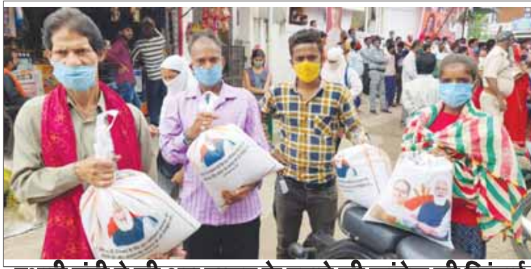
प्रभारी मंत्री ने की अन्न उत्सव के बहाने की कांग्रेस की खिंचाई मैंने वो दौर देखा है जब दिग्विजय सिंह मुख्यमंत्री थे, बाजार लुट रहे थे

पीएम मोदी 11.20 बजे पूरे देश में एक साथ देश भर में अन्न उत्सव का शुभारंभ किया। जबलपुर में 449 राशन दुकानों में अन्न उत्सव के कार्यक्रम आयोजित किए गए हैं। हर राशन दुकान में भाजपा के जनप्रतिनिधि और पदाधिकारी शामिल हुए। मुख्य कार्यक्रम पश्चिम विधानसभा के रामपुर स्थित अखाड़ा परिसर की राशन दुकान में हुआ।