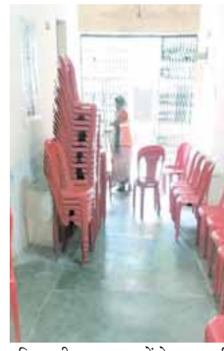
प्रतिशत टीकाकरण कराने हेतु प्रयास किये गए।

रक्ताल्पता को दूर करने के लिए विशेष रूप से तैयार इस नमक में आयरन और आयोडीन है। इसमें 850.1100 पीपीएम पाटस पर मिलियन आयरन और 20.30 पीपीएम आयोडीन है। राष्ट्रीय स्वास्थ्य सर्वेक्षण के मुताबिक प्रदेश में 6 से 59 माह के 68.9 फीसद बच्चे, 15 से 49 साल की 52.4 फीसद महिलाएं, 54 फीसद गर्भवती एवं 15 से 49 साल के 25.5 फीसद पुरुष खून की कमी के शिकार हैं। अब सरकार ने प्रदेश के 94 हजार से ज्यादा आंगनवाड़ी केन्द्रों सहित कटनी जिले के 1712 आंगनवाड़ी केन्द्रों में बच्चों, गर्भवती एवं धाती माताओं और सरकारी अस्पतालों में मरीजों के लिए बनने वाले खाने में अब डबलफोर्टिफाइड नमक का इस्तेमाल किये जाने को लेकर कवायद शुरू की है।