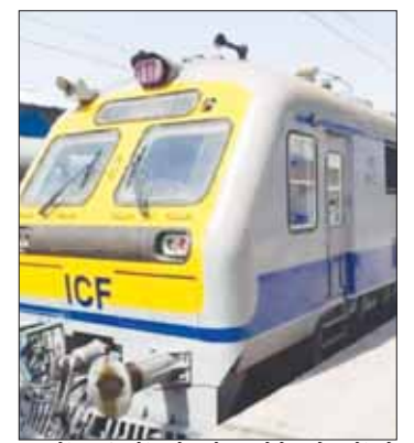
हजारों यात्रियों को छोटे-छोटे स्टेशनों से ट्रेनों में सफर करने का मौका मिले सकेगा। ये लोग इटारसी, जबलपुर, कटनी और मानिकपुर जैसे मुख्य शहरों तक पहुंच सकेंगे। भोपाल रेल मंडल के इटारसी जैसे जंक्शन स्टेशन को पहली बार कोई मेमू ट्रेन दूसरे शहरों से जोड़ेगी। मेमू ट्रेनों के लिए रेलवे ने नए रैक दिए हैं। यह ट्रेनें तेज गति से चलती हैं। इस ट्रेन को स्टेशनों पर मेल, एक्सप्रेस ट्रेनों की तुलना में रोकना ज्यादा आसान है। तेज गति के बावजूद कम समय में उक्त ट्रेनें स्कंती हैं और जल्दी गति पकड़ लेती हैं। मेल व एक्सप्रेस ट्रेनें किसी भी स्टेशन पर रुकने में समय लेती हैं और देरी से गति पकड़ती हैं। इस तरह इनमें अपेक्षाकृत ज्यादा समय लगता है और एक से दूसरे स्टेशन तक पहुंचने में यात्रियों को देरी होती है। इस वजह से मेल व एक्सप्रेस ट्रेनों को छोटे-छोटे स्टेशनों पर रोक पाना संभव नहीं होता है। मेमू ट्रेनी तरह से अनारक्षित होगी और सभी स्टेशनों पर इसके स्टॉपिंग दिए गए हैं। रेलवे ने 8 कोच (6 ट्रेलर कोच और 2 मोटर कोच) के साथ मेमू का संचालन शुरू करने का निर्णय लिया है। ड्राइविंग कोच में 55 सीट तो ट्रेलर वाले में 84 सीट होती है। 8 कोच वाले मेमू में 650 यात्री सीट पर बैठकर यात्रा कर सकेंगे। हालांकि इसमें खड़े होकर भी यात्रा कर सकते हैं।

की ओर जाएगी। जबलपुर मंडल में स्थानीय जनप्रतिनिधियों माननीय सांसदों के द्वारा उक्त मेमू ट्रेन को चलाए जाने के लिए काफी समय से सुझाव दिए जा रहे थे, इन सुझावों पर पश्चिम मध्य रेल मुख्यालय तथा रेलवे बोर्ड ने निर्णय लेते हुए उक्त मेमू ट्रेनों को चलाने का निर्णय लिया है। इन ट्रेनों के चलने से मंडल के लगभग 55 स्टेशन जो कि मानिकपुर से सतना, मैहर, कटनी, जबलपुर, नरसिंहपुर, पिपरिया मार्ग पर स्थित हैं इन स्टेशनों के यात्रियों को अब एक स्टेशन से दूसरे स्टेशन तक जाने के लिए बिना आरक्षण किए इस ट्रेन की सुविधा का लाभ मिलेगा। उल्लेखनीय है कि जबलपुर मंडल में इसके पूर्व कटनी से दमोह, सागर मार्ग से बीना के लिए भी एक मेमू ट्रेन प्रारंभ की जा चुकी है। नई मेमू ट्रेन का सतना, कटनी, जबलपुर, श्रीधाम तथा नरसिंहपुर आदि स्टेशनों पर स्थानीय जनप्रतिनिधियों द्वारा हरी झंडी दिखाकर इसे गंतव्य की ओर रवाना किया जाएगा। इस ट्रेन के चलने से