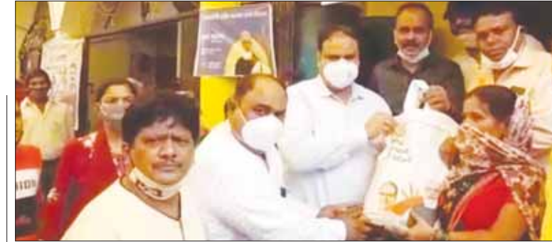
कलेक्टर ने सदर, गोरबाजार एवं गौर क्षेत्र में बांटा अन्न

प्रभारी मंत्री ने कहा कि बीजेपी हमेशा गरीबों की चिंता करती है। कांग्रेस शासन काल में बाजार लुटते थे। 2003 के पहले इस कदर महंगाई थी कि गरीबों के पास खाने को अनाज भी नहीं होता था। मेरी खुद की विधानसभा की हालत ये थी कि हाट बाजार में गेहूँ और चावल लुट जाते थे। भाजपा सरकार आई तो 80 प्रतिशत लोगों के लिए सुविधा उपलब्ध कराई है। बीजेपी सरकार ने कड़वों के लोगों को सार्वजनिक वितरण प्रणाली से जोड़ा है। पीएम ने गरीब कल्याण योजना के तहत नवंबर तक मुफ्त राशन देने की योजना बनाई है। इस पर कांग्रेस को दर्द नहीं होना चाहिए।