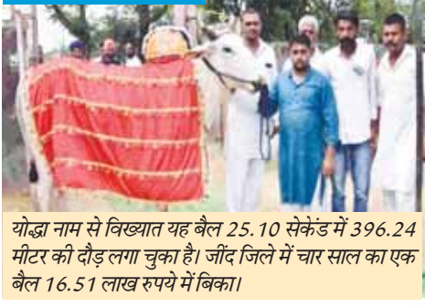
योद्धा नाम से विख्यात यह बैल 25.10 सेकेंड में 396.24 मीटर की दौड़ लगा चुका है। जींद जिले में चार साल का एक बैल 16.51 लाख रुपये में बिका।