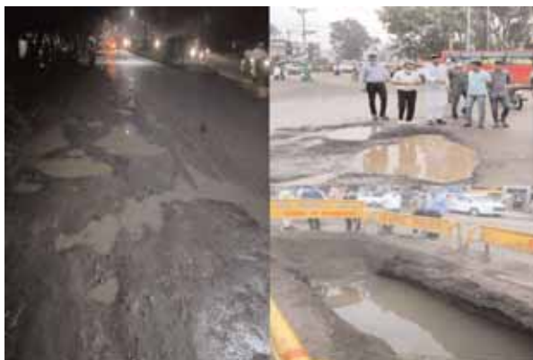
बजरो और डामर नए सिरे से बिछाने का काम अभियान के तौर पर किया जाएगा। आगामी 15 अक्टूबर तक सड़कों की सूरत बदल जाएगी। सभी सड़कें दुरुस्त करवाई जाएंगी।