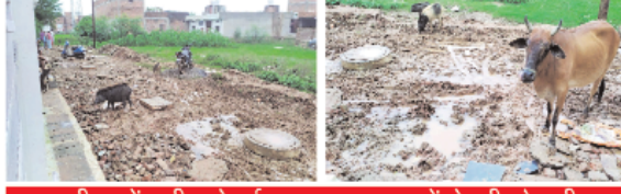
कीचड़ में तब्दील हो गई सड़क, आवागमन में हो रही परेशानी

भी क्षेत्र के लोगों को उठाना पड़ रहा था। सावरकर वार्ड के अंतर्गत आधारकाप भूसीन के बगीचा के पास कॉलोनी के निर्माण के बाद क्षेत्रीय नागरिकों की मांग पर नगर निगम प्रशासन द्वारा यहां सड़क निर्माण की स्वीकृति दी थी। स्वीकृति मिलने के बाद संबंधित ठेकेदार द्वारा सड़क बनाने के लिए खुदाई की गई, लेकिन सड़क का निर्माण शुरू नहीं किया जा रहा था। बारिश का मौसम होने की वजह से पूरी सड़क दलदल में तब्दील हो गई थी। लोगों के घरों के सामने कीचड़ का साम्राज्य हो गया है। घरों से निकलना तक मुश्किल हो रहा था। कुछ समय पहले सीवर लाइन के लिए ठेकेदार ने सड़क खोद दी थी और सीवर लाइन बिछाने के बाद गड़दों को नहीं भरा था, जिससे यहां आए दिन दुर्घटनाएं हो रही थी। यश भारत में इस खबर के प्रकाशन के बाद नगर निगम प्रशासन द्वारा सड़क का निर्माण शुरू किया गया है।