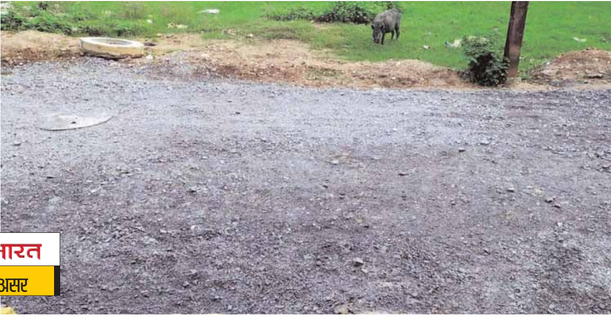
यश भारत खबर का असर