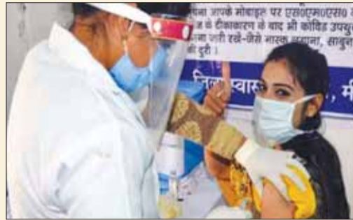
लिए बुधवार को 8000 सत्र आयोजित किए जाएंगे। स्वास्थ्य मंत्री डॉ प्रभुराम चौधरी ने बताया कि ज्यादा से ज्यादा लोग टीका लगवाने के लिए आएँ, इसके लिए प्रदेश भर में टीमें काम कर रही हैं।

भोपाल । कोरोना टीकाकरण महाअभियान के दूसरे चरण में आज पहले दिन 20 लाख लोगों को कोविड-19 से बचाव के टीके का पहला और दूसरा डोज लगाया जाएगा। कोवैक्सीन और कोविशील्ड दोनों वैकसीन लगाई जाएंगी। दो दिन के इस अभियान में गुरुवार को 15 लाख लोगों को टीका लगाने का लक्ष्य है। इसके लिए प्रदेश के टीकाकरण केंद्रों में 36 लाख डोज वैकसीन पहुंचा दी गई है। स्वास्थ्य विभाग के अधिकारियों ने बताया कि मंगलवार को भी केंद्र सरकार से नौ लाख डोज मिले हैं। पहले से 27 लाख डोज उपलब्ध थे। बुधवार को भी टीका केंद्र से मिलेगा। प्रदेश भर में टीकाकरण के लिए बुधवार को 8000 सत्र आयोजित किए जाएंगे। स्वास्थ्य मंत्री डॉ प्रभुराम चौधरी ने बताया कि ज्यादा से ज्यादा लोग टीका लगवाने के लिए आएँ, इसके लिए प्रदेश भर में टीमें काम कर रही हैं।