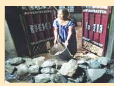
चेतावनी जारी की है। वहीं बिहार में भी एक बार फिर से भारी बारिश हो सकती है। मौसम विभाग ने उत्तराखंड में भारी बारिश की चेतावनी जारी की है। राज्य में मौसम विभाग ने कई जिलों में येलो अलर्ट जारी किया है। मौसम विभाग के मुताबिक 27 अगस्त तक उत्तराखंड के कई हिस्सों में भी तेज बारिश हो सकती है।

देहरादून । यहां बादल फटने के कारण भारी बारिश हो रही है। यहां पूरा शहर पानी-पानी हो गया है। उत्तराखंड में मौसम विभाग ने अगले 24 घंटे में भारी बारिश का अलर्ट जारी किया है। सुरक्षा व बचाव के लिए राहत दल पहले ही तैनात किया जा चुका है। मिली जानकारी के मुताबिक देहरादून के संतला देवी मंदिर के पास बादल फटने के कारण विकट स्थिति निर्मित हो गई है। पहाड़ों की मिट्टी व पथर बरसने से लोगों की मुसीबत ज्यादा बढ़ गई है। देहरादून में आईटी पार्क में लगभग पानी भर गया है। हालांकि अभी तक जानमाल के ज्यादा नुकसान की खबर नहीं है। देश के कई राज्यों में मानसून अभी भी सक्रिय है और मौसम विभाग ने 27 अगस्त तक भारी बारिश का अलर्ट जारी किया है। मौसम विभाग की ओर से दी गई जानकारी के मुताबिक उत्तर प्रदेश और बिहार को फिलहाल बारिश से राहत मिलती नहीं दिख रही है। यहां 27 अगस्त तक भारी बारिश की संभावना जताई जा रही है। इसके साथ ही मौसम विभाग ने पूर्वी उत्तर प्रदेश में 26 अगस्त तक बारिश की फिलहाल बारिश से राहत मिलती नहीं दिख रही है।