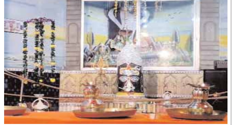
कटनी। पुरानी बस्ती गौतम मोहल्ला स्थित शिवशक्ति मंदिर में इस वर्ष भी तीजा महोत्सव पर भगवान भोलेनाथ का चाँदी के आभूषणों से श्रंगार किया जाएगा। विशेष रूप से चाँदी का कुलहरा आकर्षण का केन्द्र रहेगा।