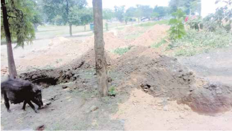
क्या था गुस्सा, एक अन्य समाज के कुछ लोगों ने भी सोमवार की सुबह भूमिपूजन करते हुए अपने आराध्य देव जी के मंदिर निर्माण की कवायद करते हुए जेसीबी से पहले से खुदे गड्डे के बगल से गड्डे खुदवा दिए गए।

बर्ही। कटनी जिले का प्रसिद्ध आस्था का धार्मिक केंद्र विजयनाथधाम शिव मंदिर प्रांगण में कब्जे की होड़ मची हुई है। अतिक्रमणकारी धर्मशाला, मंदिर निर्माण के नाम पर बेखोफ होकर अतिक्रमण करने अमादा है। रोक के बाद भी जबरिया नायाजय अधिपत्य जमाने का गंदा खेल जारी है। जी हां 2 साल पूर्व एक समाज विशेष द्वारा रातोंरात मंदिर समिति के विरोध के बाद भी जनबल, धनबल एवं दबाव की राजनीति करते हुए अस्थाई मंदिर का निर्माण कर दिया जिसके उपरांत प्रशासनिक हस्तक्षेप के बाद निर्माण में रोक लगी। कुछ महीने मात्र शांत रहा और इसी बीच फिर सक्रिय हुए विश्वकर्मा समाज के कुछ लोगों ने चोरी-छिपे प्लेथ पिलर का निर्माण कर लिया। प्रशासन की मदद न मिलने से मंदिर समिति के तथाकथित मठाधीश बने पदाधिकारियों ने नाराज होकर नया परंपर रचा, एक अन्य समाज विशेष को आगे करते हुए मंदिर के प्रवेश द्वार के पहले सेन समाज के धर्मशाला के पास रविवार की दोपहर एक नया धर्मशाला निर्माण के लिए जेसीबी से गड्डे खुदवा दिए गए। इस बात की भनक पूरे नगर में फैल गई, फिर होना