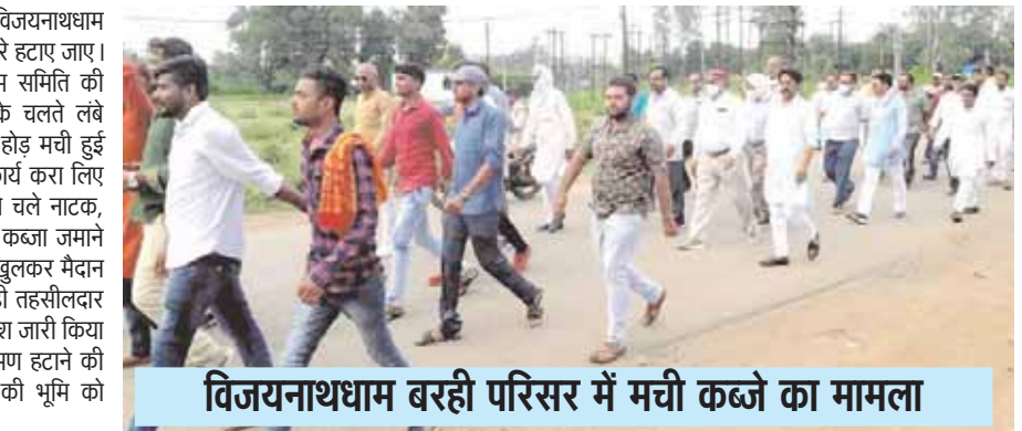
विजयनाथम बरही परिसर में मची कब्जे का मामला

में बने सभी मंदिरों, भवनों को विजयनाथम ट्रस्ट के अधीन किया जाए, टपरे हटाए जाए। गौरतलब है कि विजयनाथम समिति की सुरती एवं भाई-भतीजावाद के चलते लंबे अरसे से यहां अतिक्रमण की होड़ मची हुई है। रोक के बाद भी निर्माण कार्य करा लिए जाते हैं, वहीं पिछले 3 दिन से चले नाटक, जिसमें दो अन्य समुदाय द्वारा कब्जा जमाने से आक्रोशित ब्राह्मण समाज खुलकर मैदान में उतर आया, हालांकि कल ही तहसीलदार ने यहां किसी भी तरह का निर्माण न होने का स्थगन आदेश जारी किया है। अब देखा यह दिलचस्प होगा कि प्रशासन अतिक्रमण हटाने की कार्यवाही करता है या फिर यूं ही भगवान भीलेनाथ की भूमि को अतिक्रमणकारियों को नोचने की छूट दे दी जाएगी।